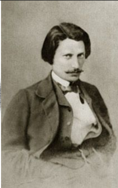
Владимир Михайлович Жемчужников