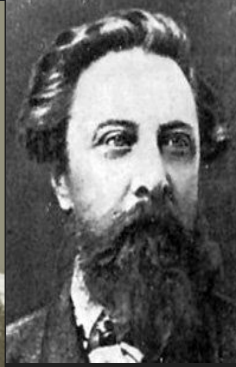
Алексей Константинович Толстой