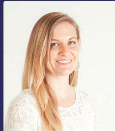
КРИСТА / США