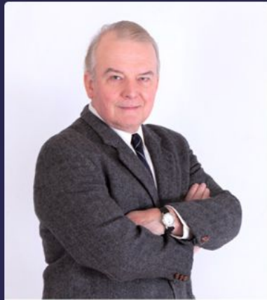
ЛЕН / США