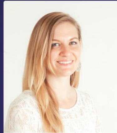
КРИСТА / США