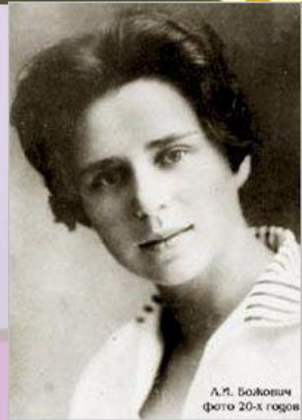
Л.И. Божович фото 20-х годов

Другая группа мотивов отличается тем, что входящие в нее мотивы находятся за пределами учебного процесса