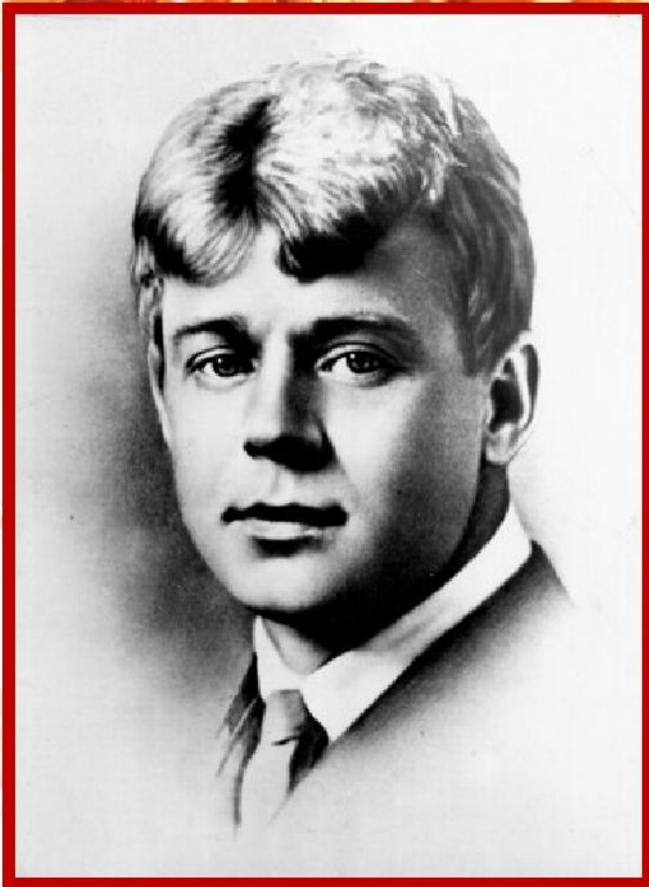
Сергей Александрович Есенин (1895-1925)