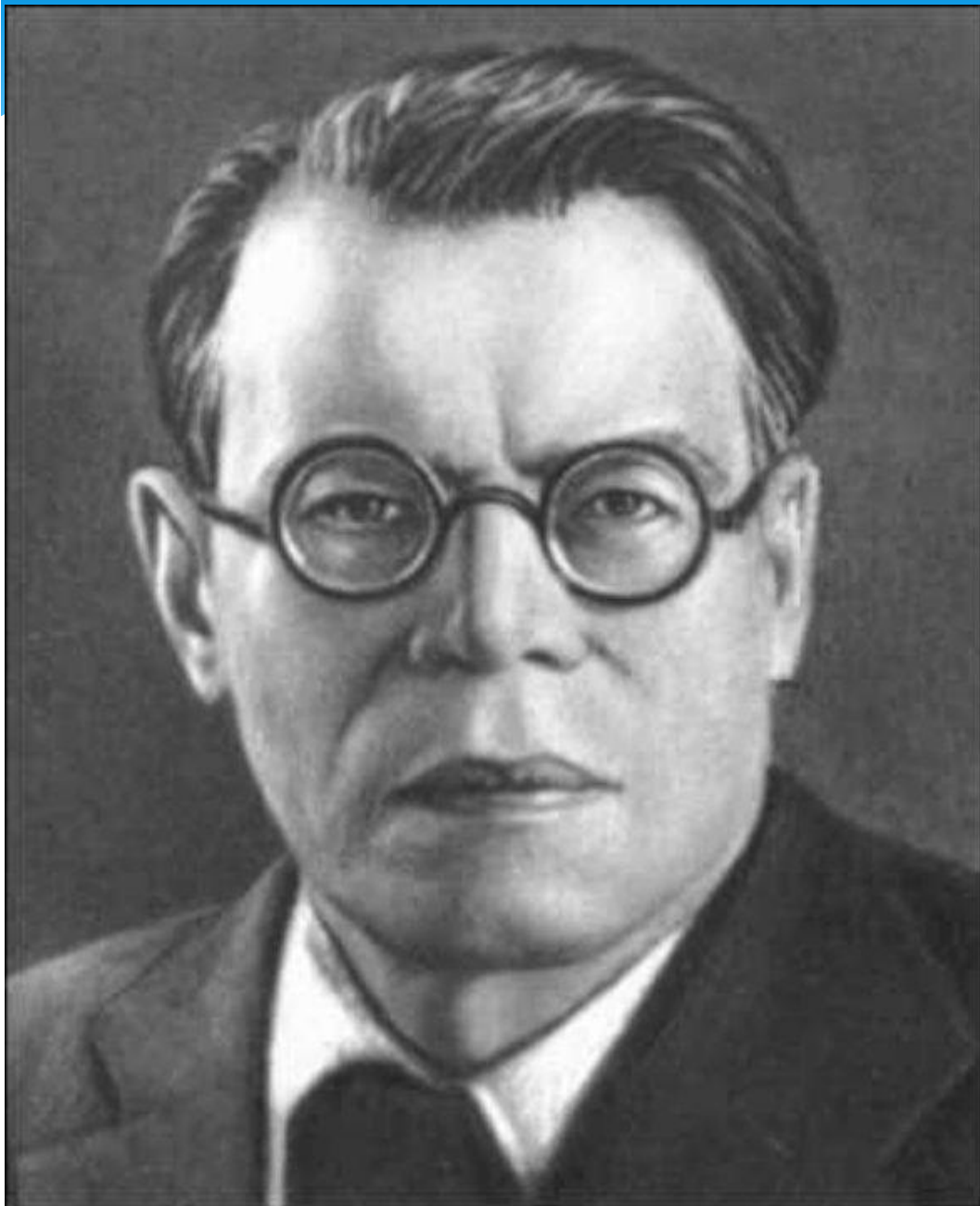
Михаил Васильевич Исаковский