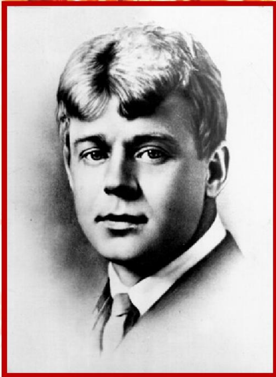
Сергей Александрович Есенин (1895-1925)