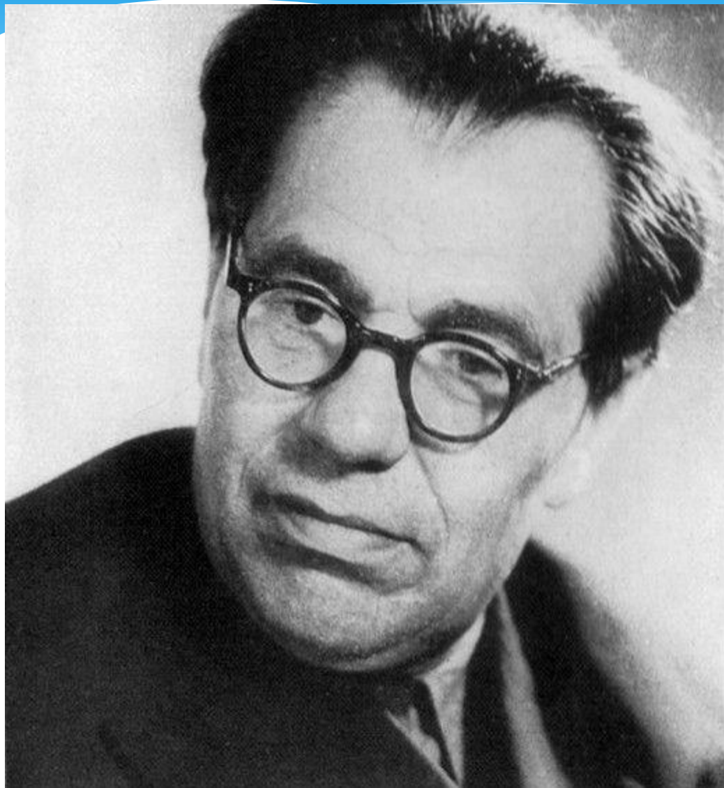
Николай Иванович Рыленков