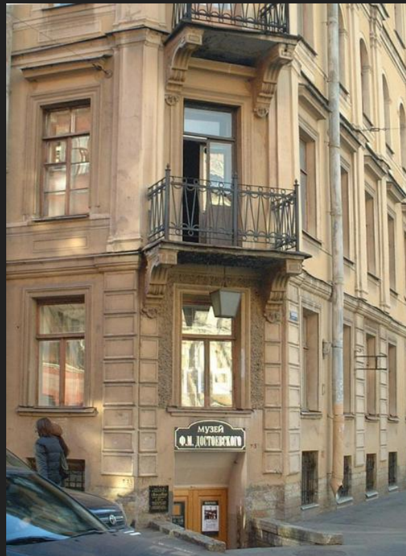
Кузнечный переулок, 5/2 (сегодня - музей-квартира Достоевского)