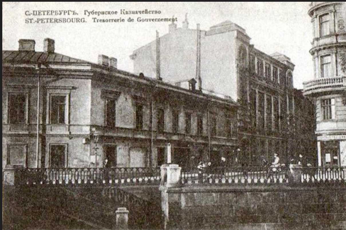
Старая открытка с изображением дома до реконструкции