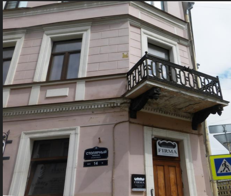
Столярный переулок, 14, угол Казначейской ул., 7 (доходный дом Алонкина)