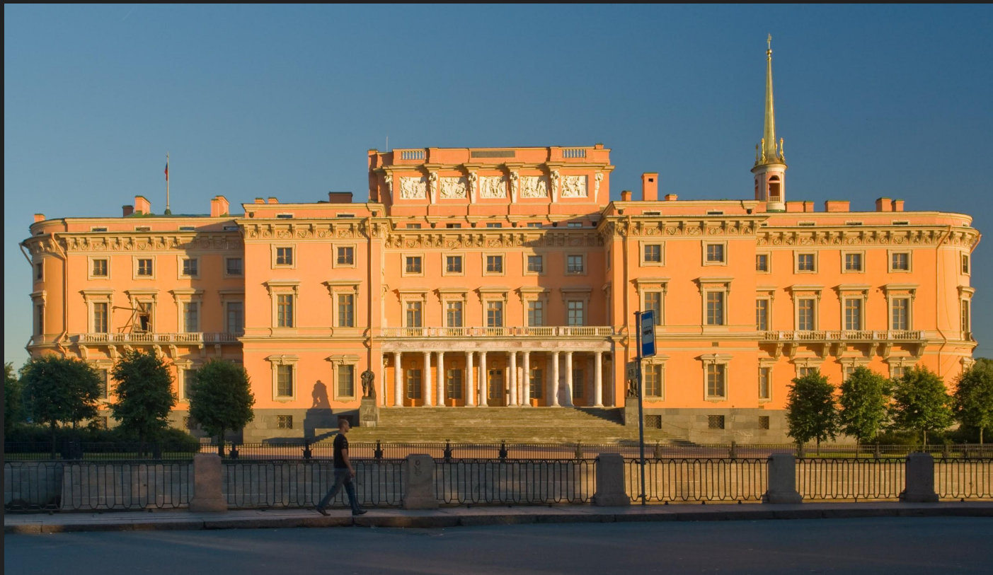
Михайловский (Инженерный) замок