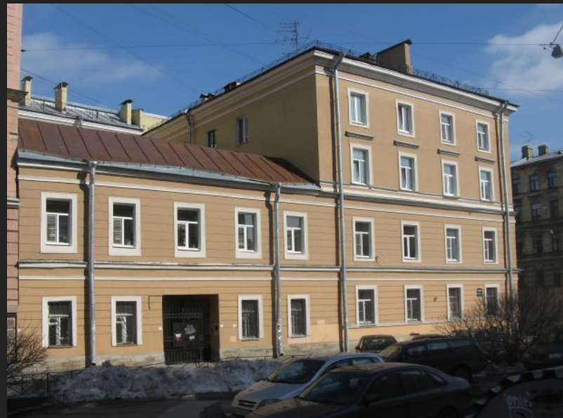
Греческий проспект, 6, угол 5-й Советской улицы, 6 (доходный дом Струбинского)