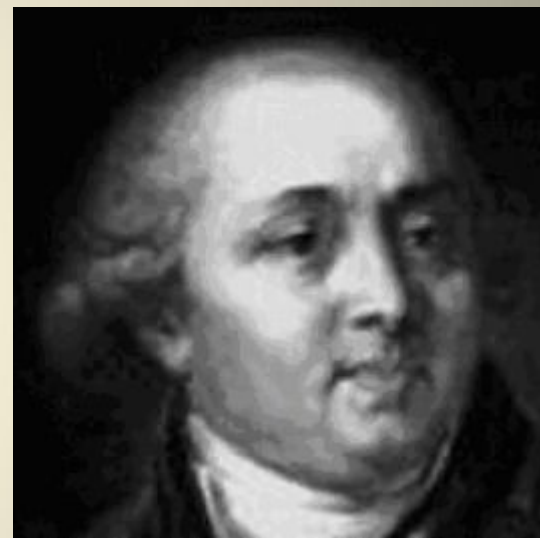
СТАРОВ Иван Егорович русский архитектор