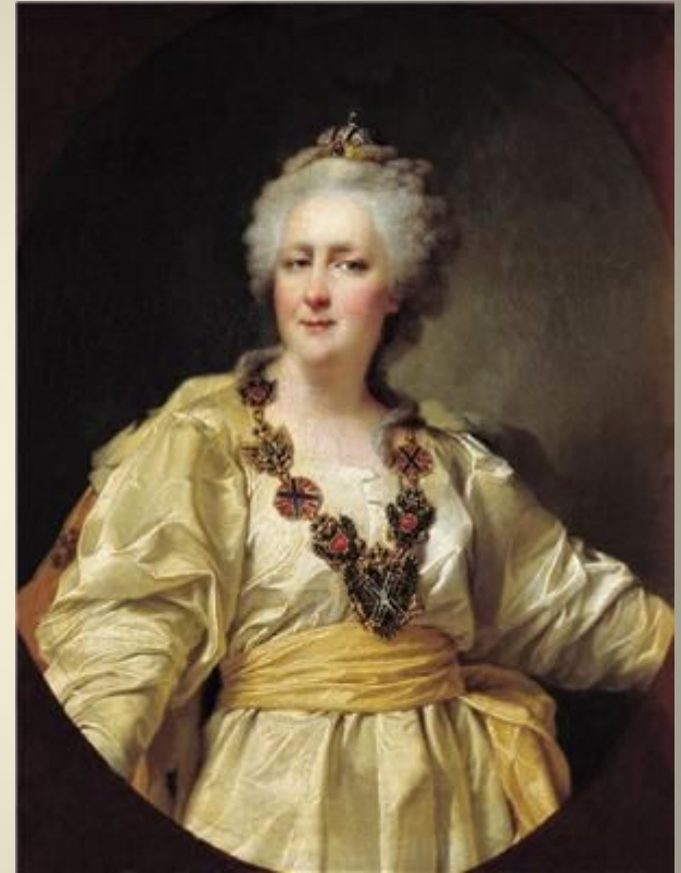
Императрица Екатерина Вторая

Таврический дворец был построен по указанию Екатерины II для своего фаворита, светлейшего князя Г. А. Потёмкина. На возведение и отделку дворца было затрачено около 400 000 рублей золотом. Дворец получил своё название по его титулу Князь Таврический, который был пожалован ему в 1787 году, после присоединения к Российской империи Крыма (Таврии). От названия Таврического дворца происходят наименования Таврического сада, Таврической улицы и Таврического переулка.