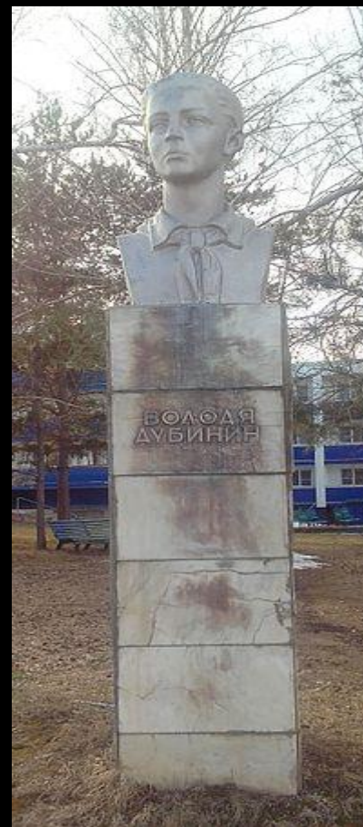
Памятник В. Дубинину на территории бывшего пионер. лагеря «Алые паруса» в с. Ягодное близ Тольятти