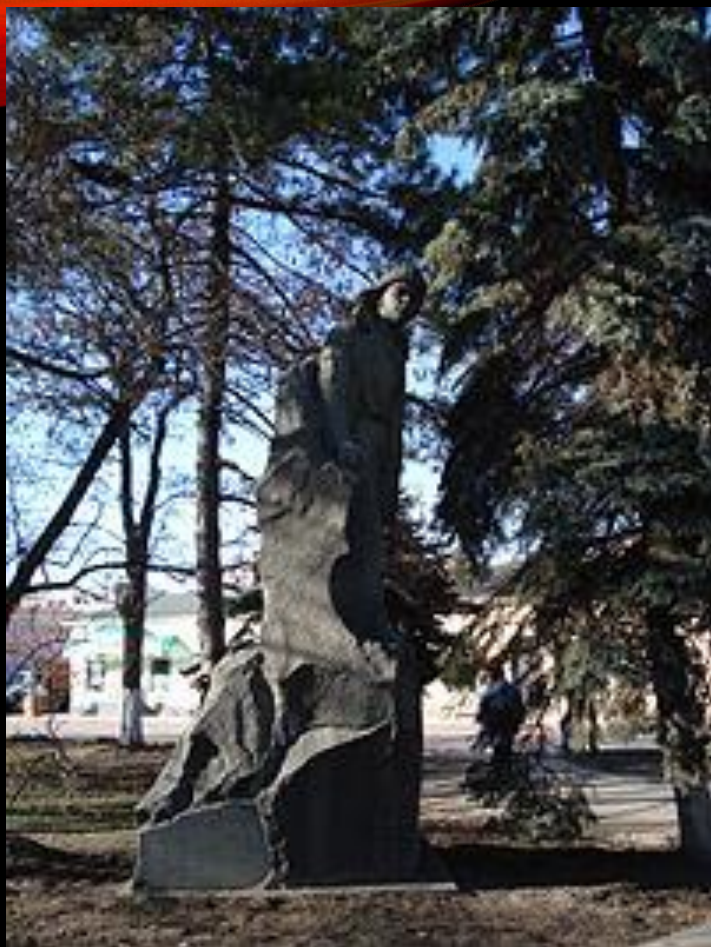
Памятник Владимиру Дубинину в г. Керчь