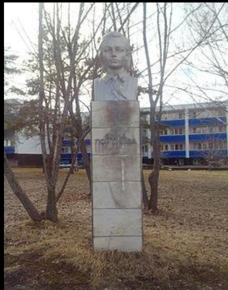
Памятник Зине Портновой на территории быв. пионер. лагеря «Алые паруса» в с. Ягодное близ Тольятти