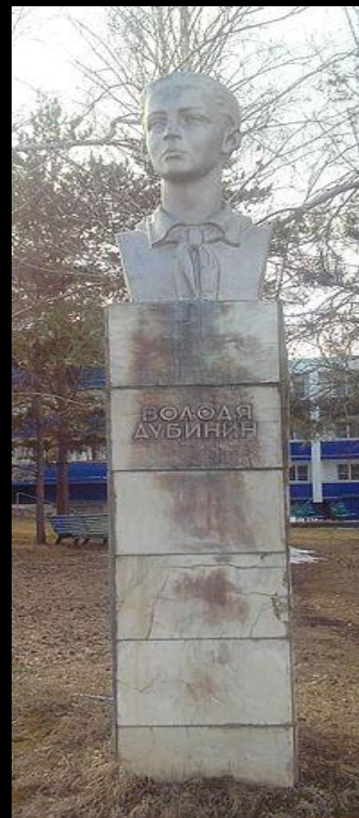
Памятник В. Дубинину на территории бывшего пионер. лагеря «Алые паруса» в с. Ягодное близ Тольятти