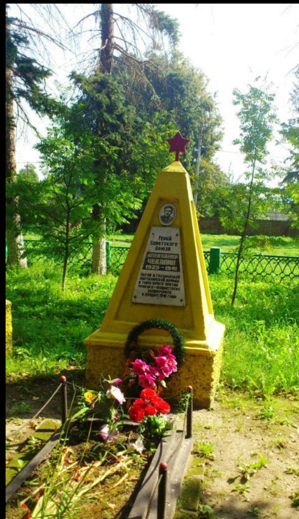
Могила в г. Чекалин