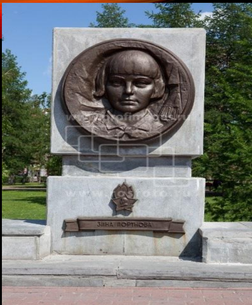
Челябинск. Парк "Алое поле". Аллея пионеров-героев. Зина Портнова