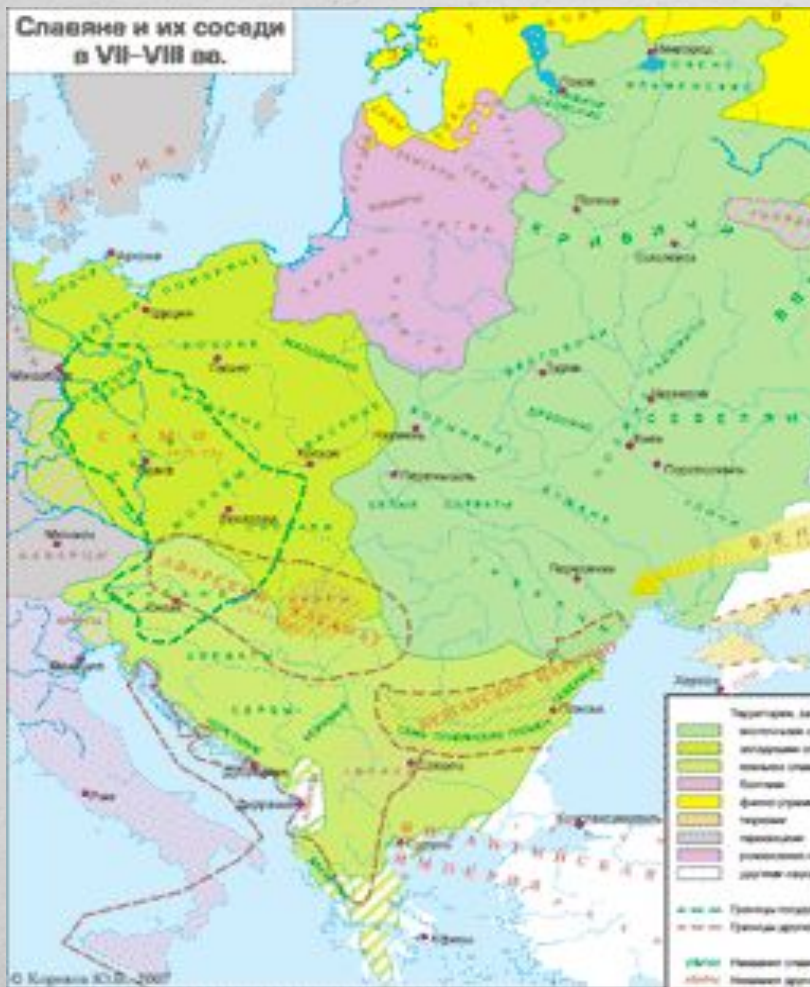
Славяне и их соседи в VII–VIII вв.

Киевская Русь возникла на торговом пути «из варяг в греки» на землях восточнославянских племен — ильменских словен, кривичей, полян, охватив затем древлян, дреговичей, полчан, радимичей, северян, вятичей.