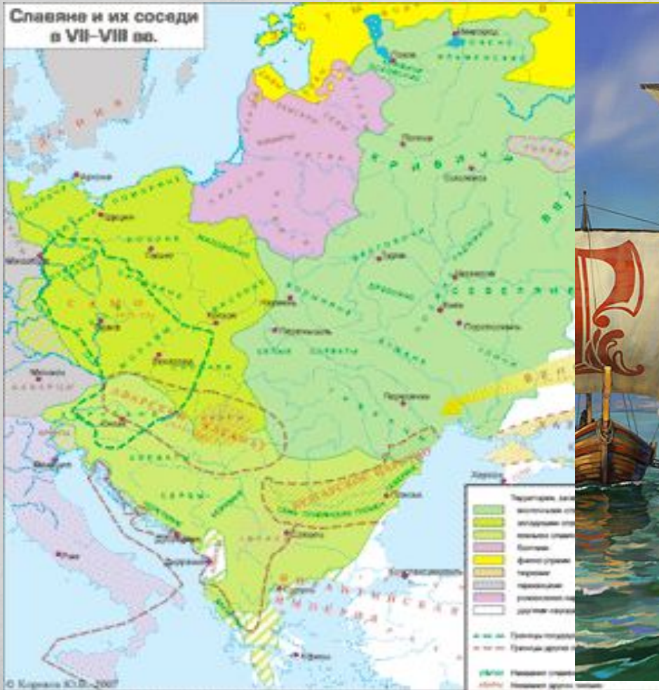
Славяне и их соседи в VII–VIII вв.

Киевская Русь возникла на торговом пути «из варяг в греки» на землях восточнославянских племен — ильменских словен, кривичей, полян, охватив затем древлян, дреговичей, полчан, радимичей, северян, вятичей.