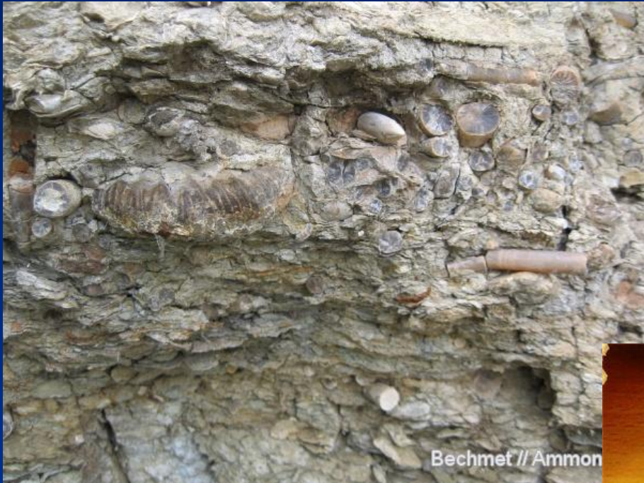
Bechmet // Ammon