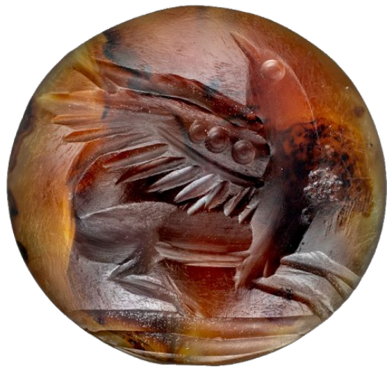
Один из резных камней

Так же грифон был изображен на одном из резных камней (всего их найдено более 50).