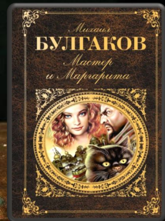
«Мастер и Маргарита»

«Тот, кто любит, должен разделять участь того, кого он любит.»