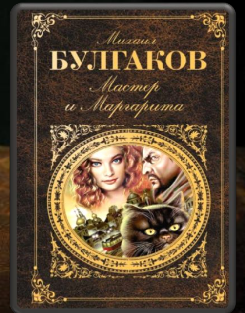
«Мастер и Маргарита»

«Несчастный человек жесток и черств. А все лишь из-за того, что добрые люди изуродовали его.»