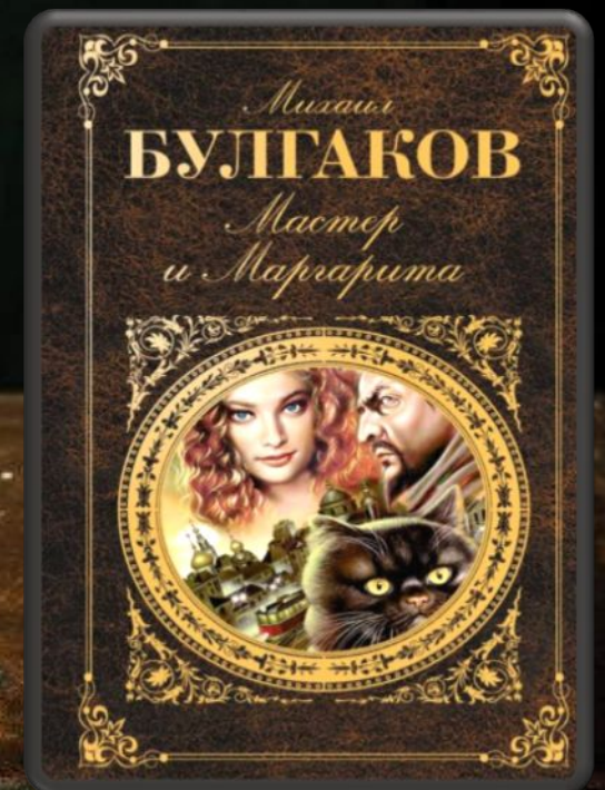
«Мастер и Маргарита»

«Никогда и ничего не просите! Никогда и ничего, и в особенности у тех, кто сильнее вас. Сами предложат и сами всё дадут!»