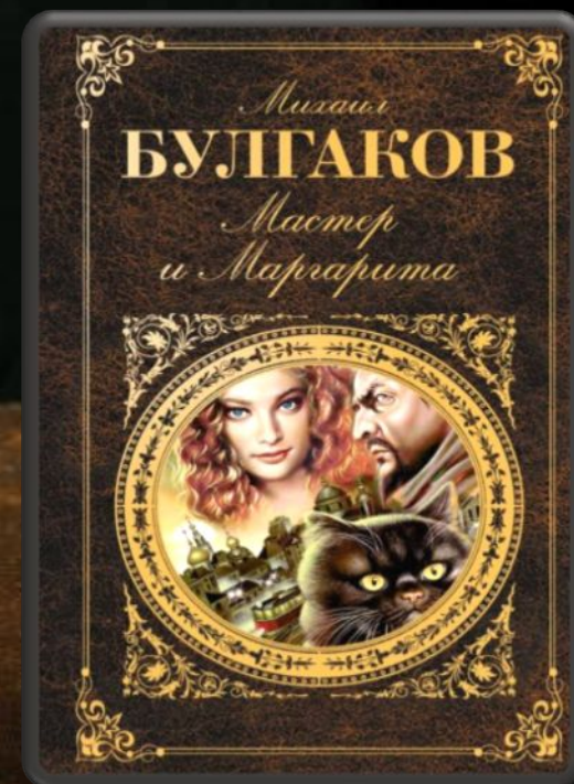
«Мастер и Маргарита»

«Да, человек смертен, но это было бы еще полбеды. Плохо то, что он иногда внезапно смертен, вот в чем фокус!»