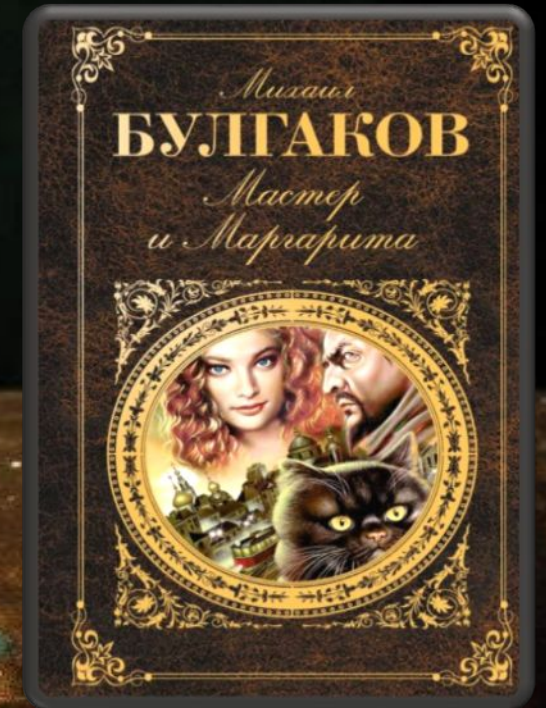
«Мастер и Маргарита»

«Все теории стоят одна другой. Есть среди них и такая, согласно которой каждому будет дано по его вере. Да сбудется же это!»