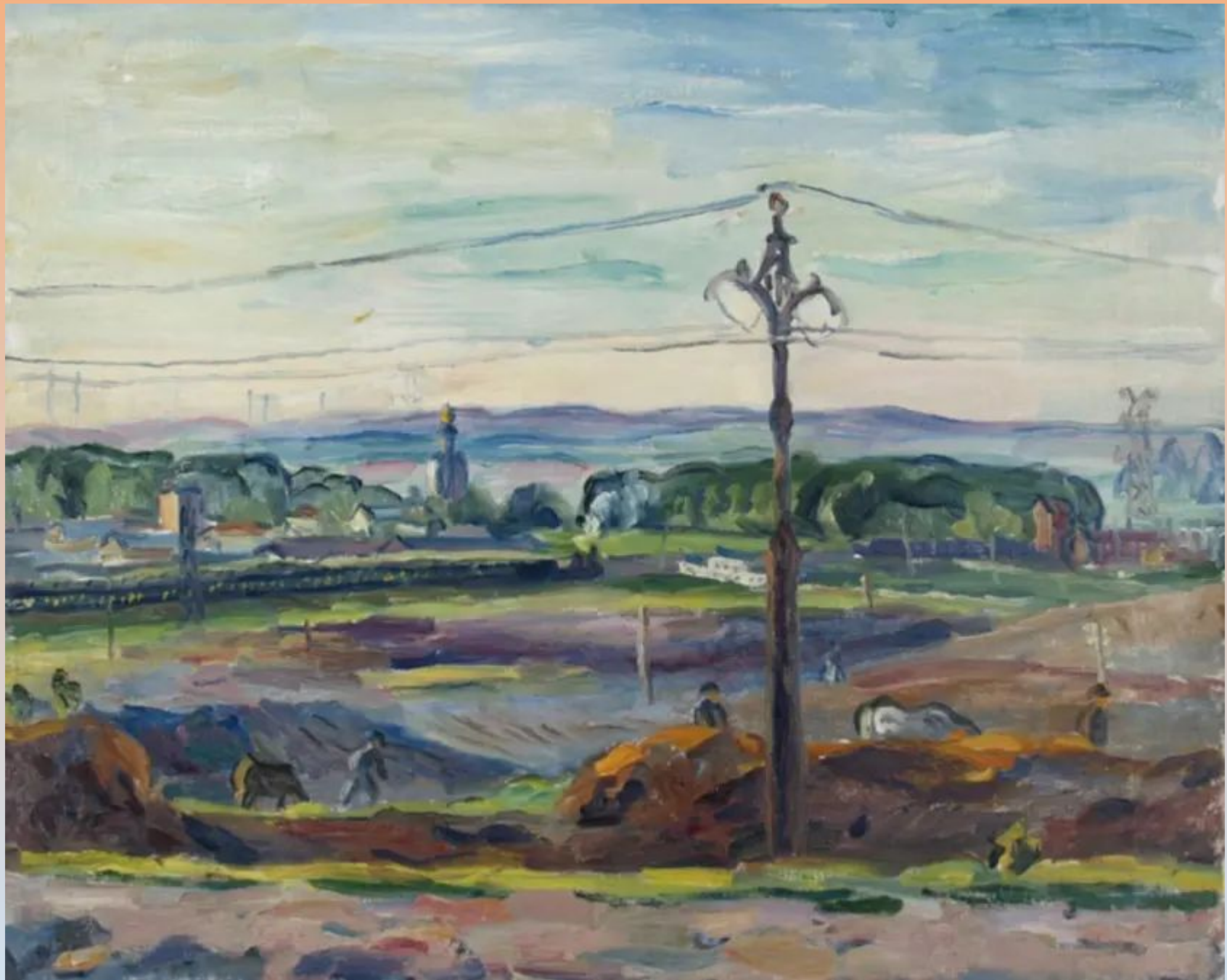
В окрестностях Москвы. 1940