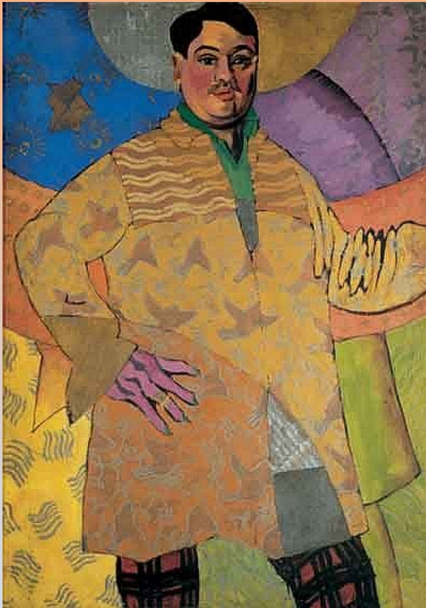
Автопортрет. «Le grand peintre». 1915. Холст, масло. ГТГ

Аристарх Васильевич ЛЕНТУЛОВ 1882, с. Воронье Пензенской губ. – 1943, Москва