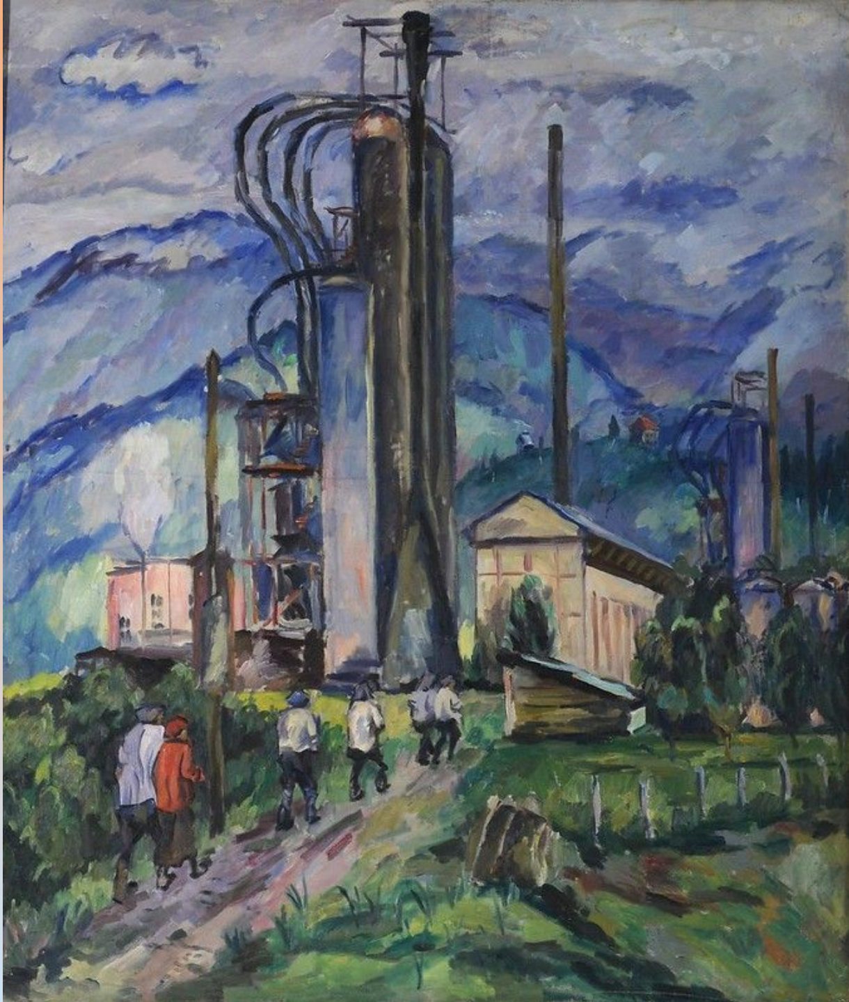
Аристарх Лентулов. Крекинг нефтеперегонного завода. 1930-1931. Холст, масло, 192x163. Саратовский государственный художественный музей имени А.Н. Радищева.