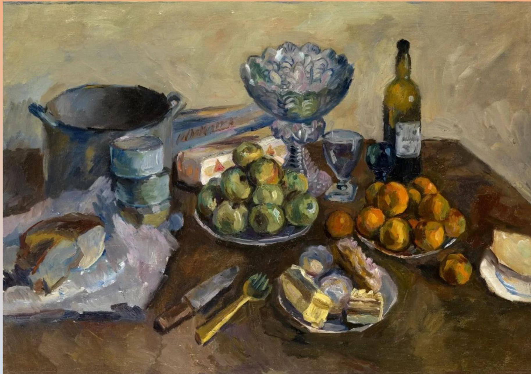
Натюрморт с пирожными и фруктами