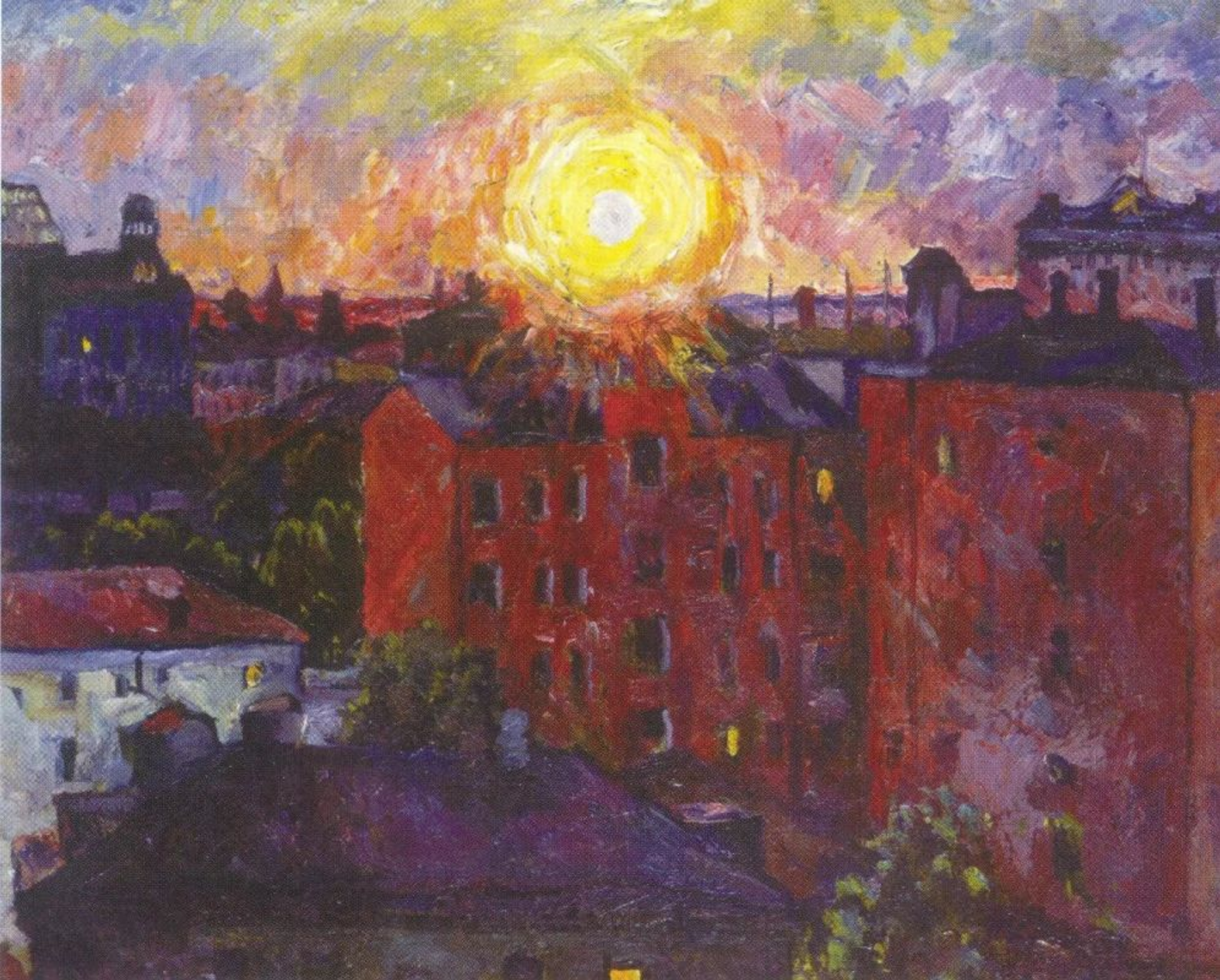
Солнце над крышами. Закат 1928