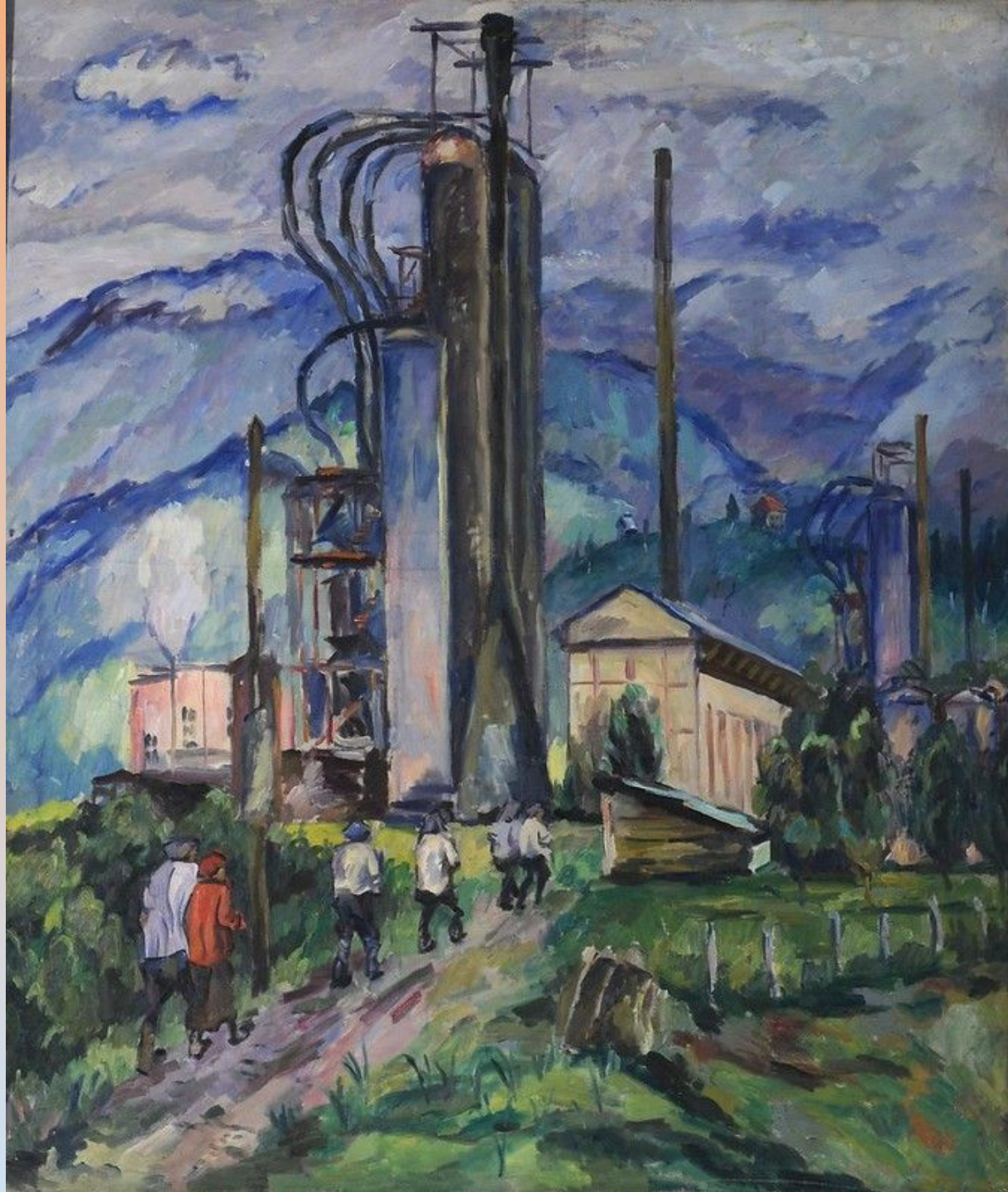
Аристарх Лентулов. Крекинг нефтеперегонного завода. 1930-1931. Холст, масло, 192x163. Саратовский государственный художественный музей имени А.Н. Радищева.