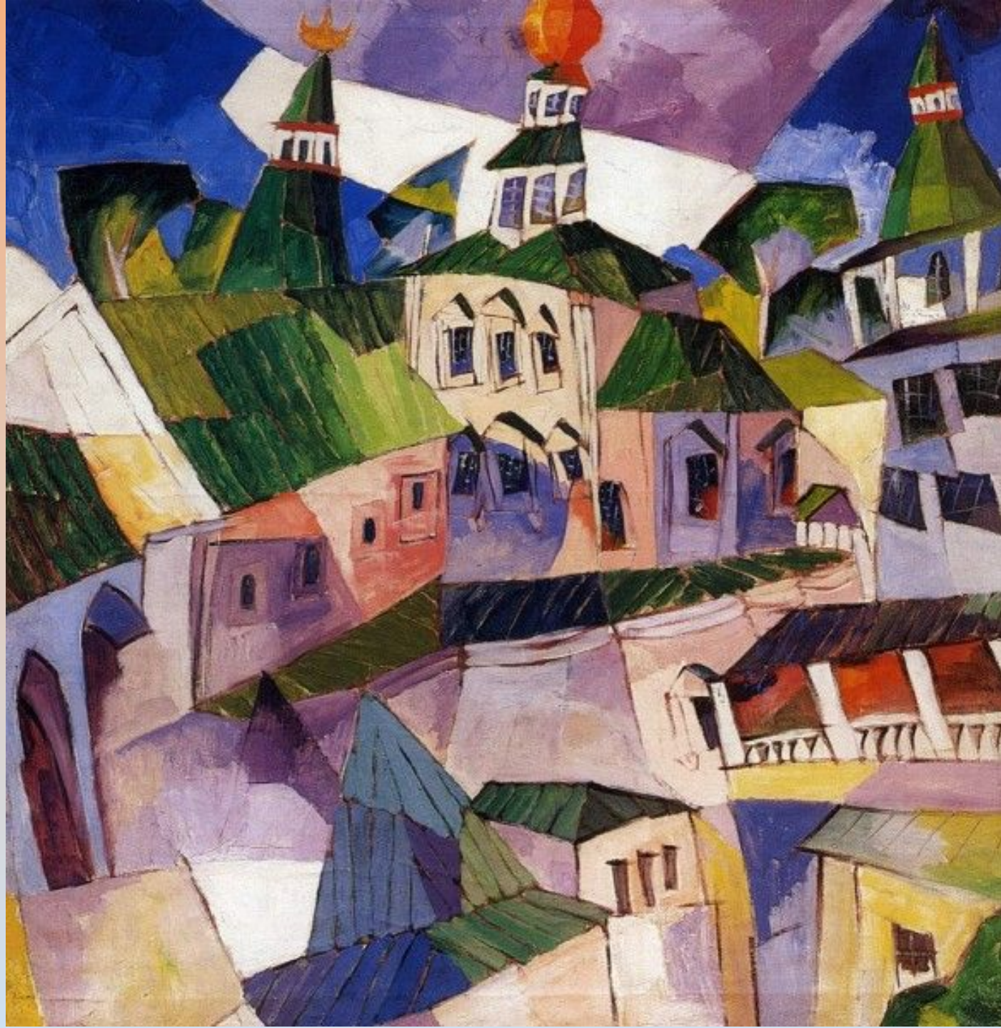
Монастырь Начало 1910-х (1917?)