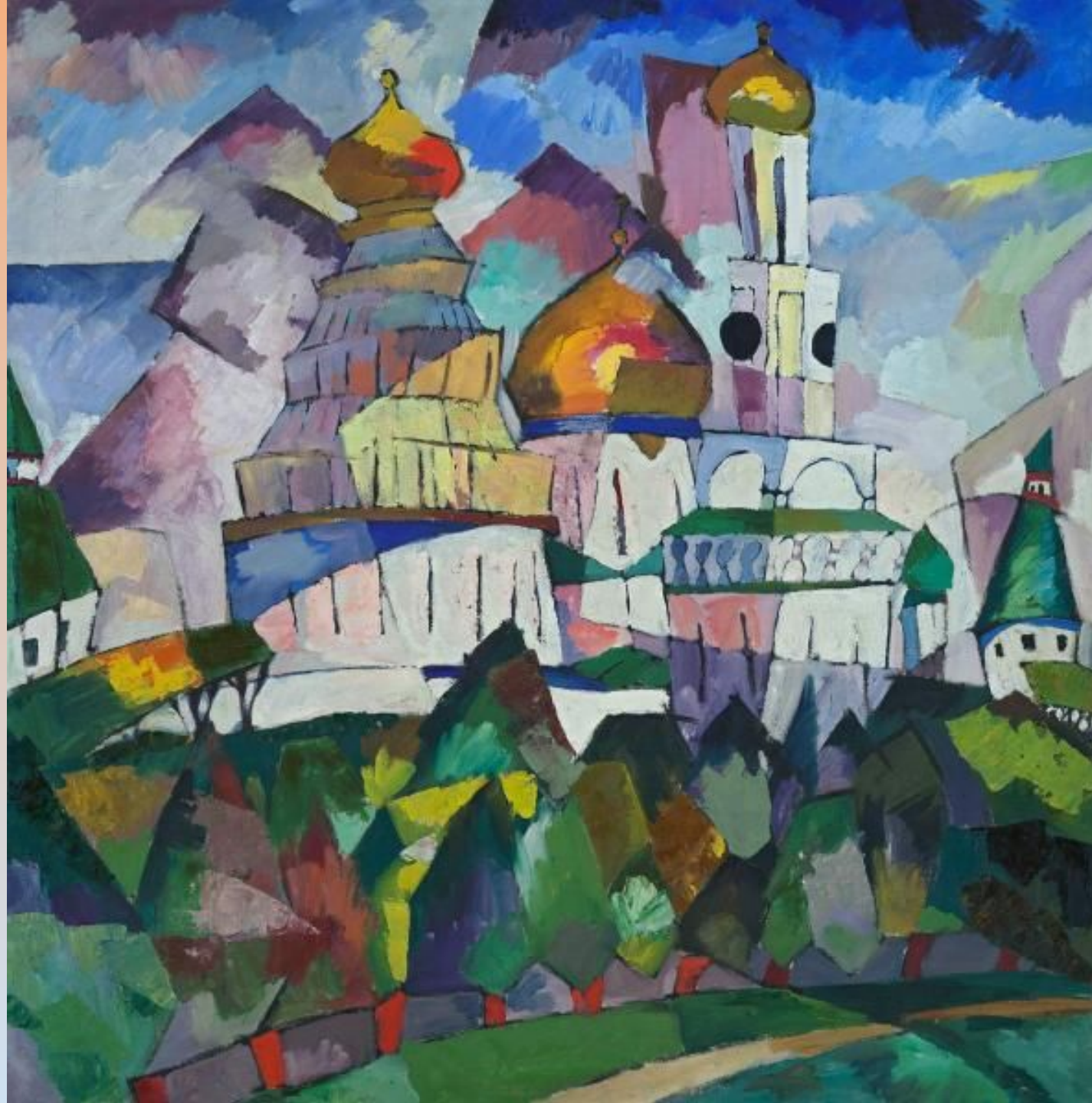
Церкви. Новый Иерусалим 1917