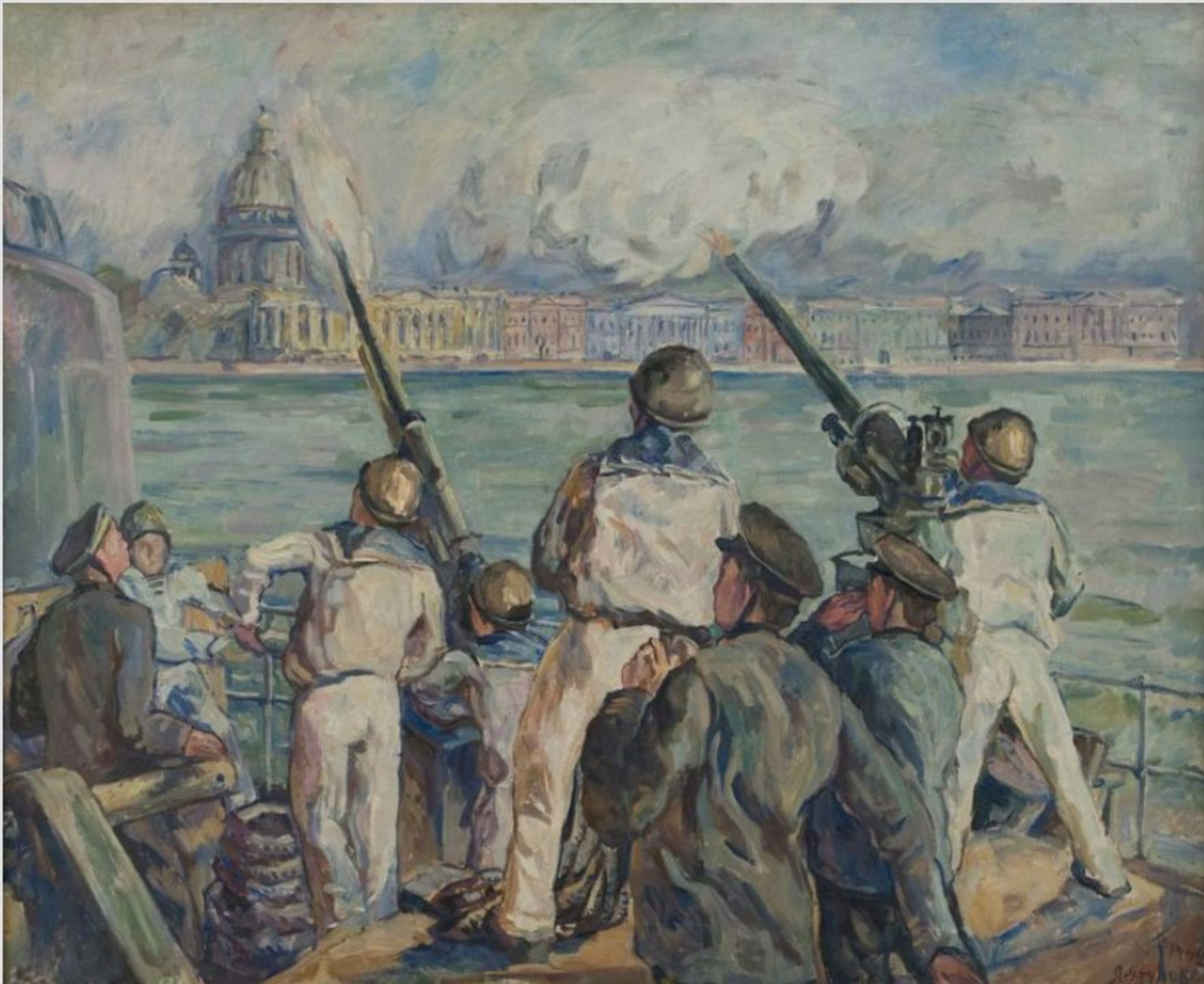
Защита Ленинграда. 1942 Самарский областной художественный музей