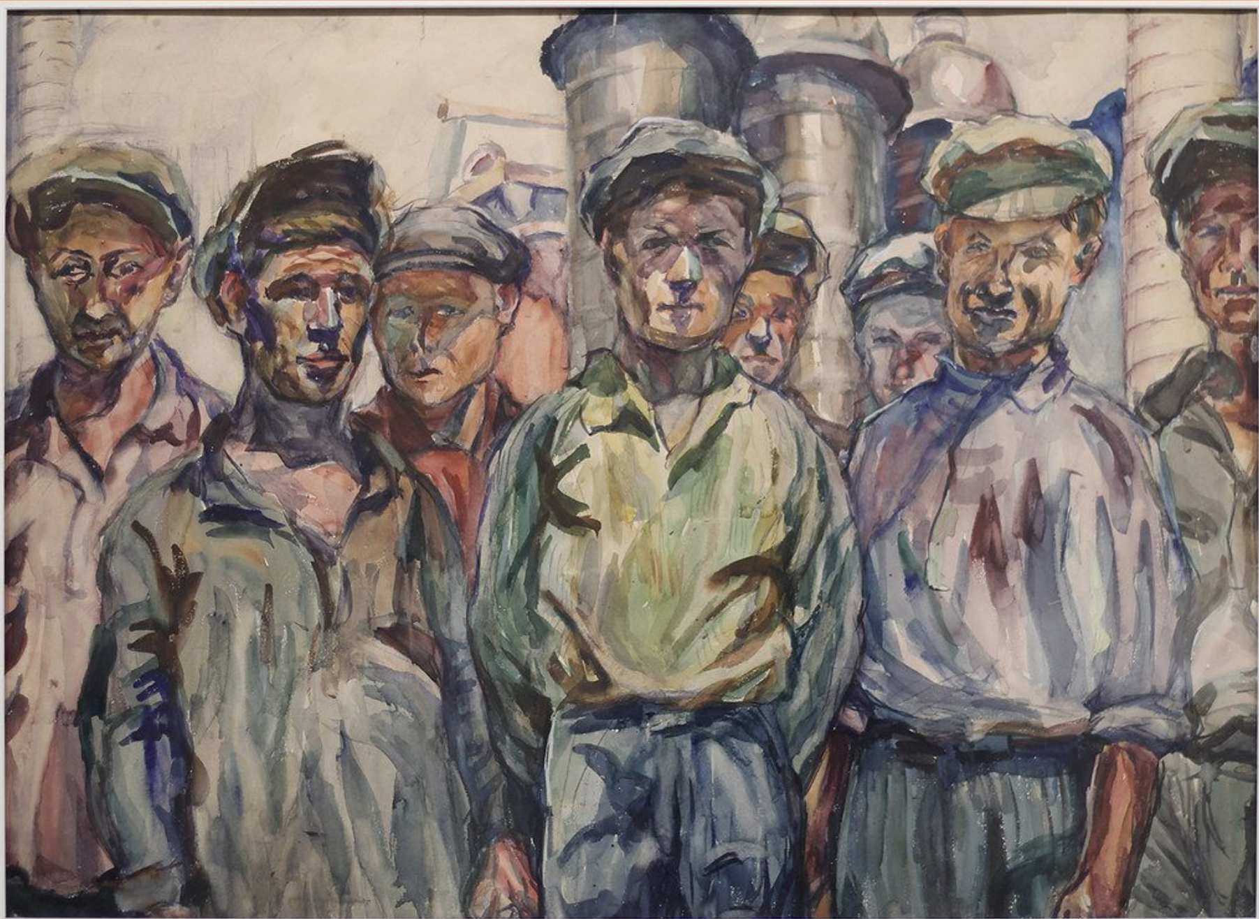
Рабочие Керченского металлургического завода им. Войкова. 1930. Бумага, акварель. Коллекция Челябинского трубопрокатного завода.