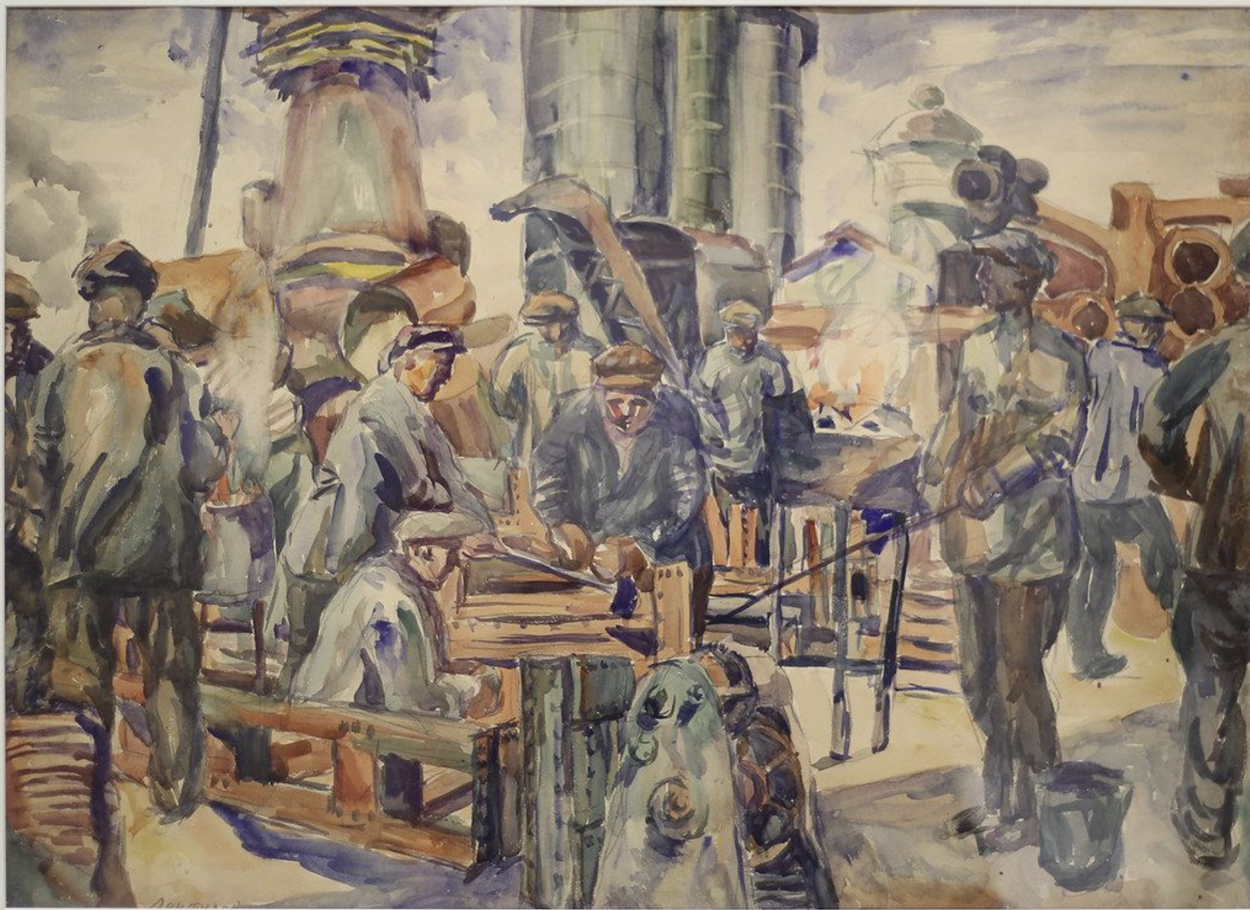
Котельщики Керченского металлургического завода им. Войкова. 1931. Бумага, акварель. Коллекция Челябинского трубопрокатного завода.