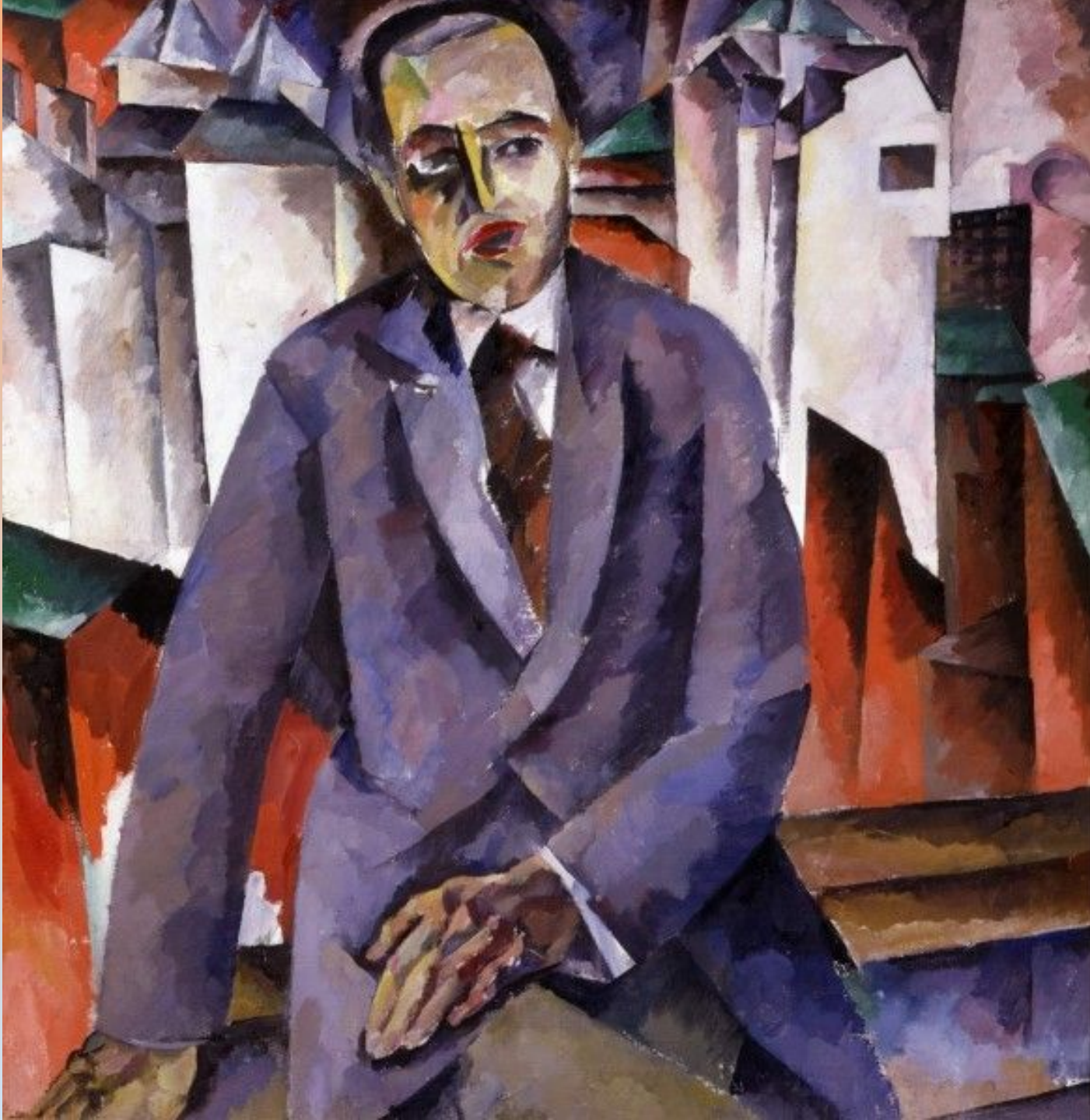
Портрет А. Я. Таирова 1918–1919