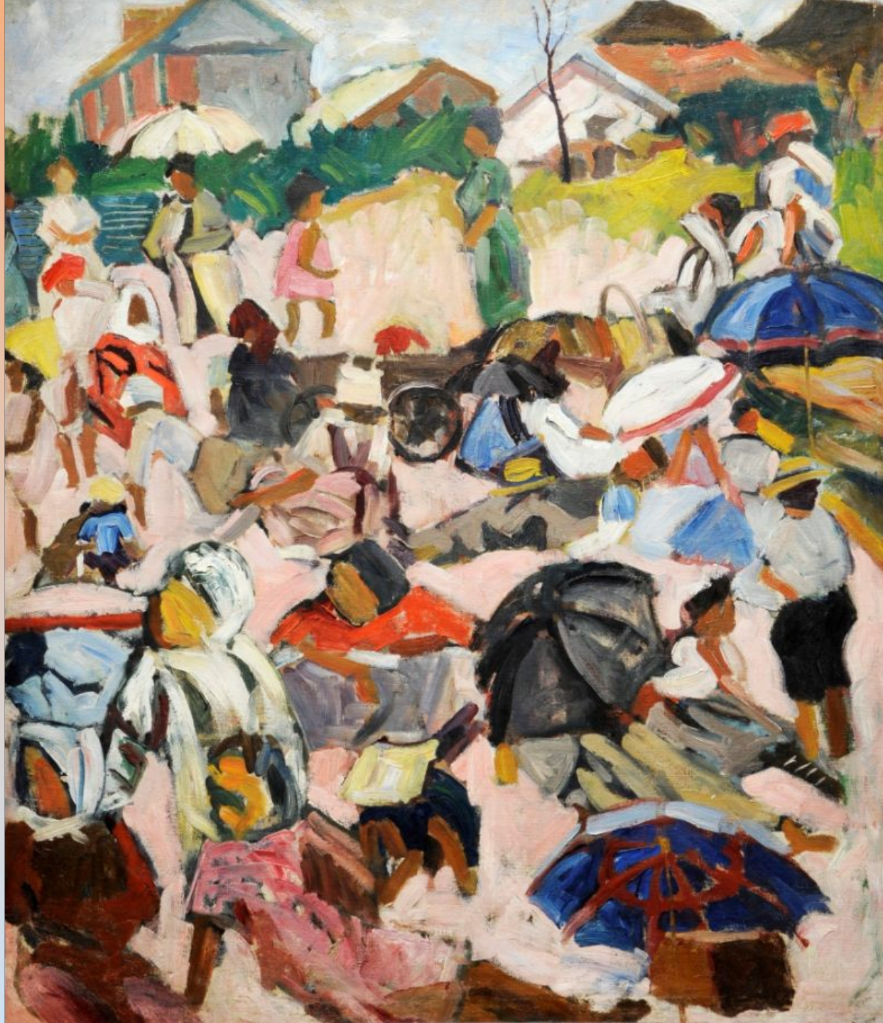
Зонтики. Пляж Начало 1910-х