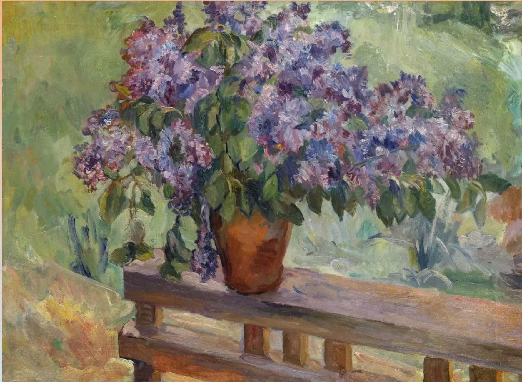
Натюрморт с сиренью