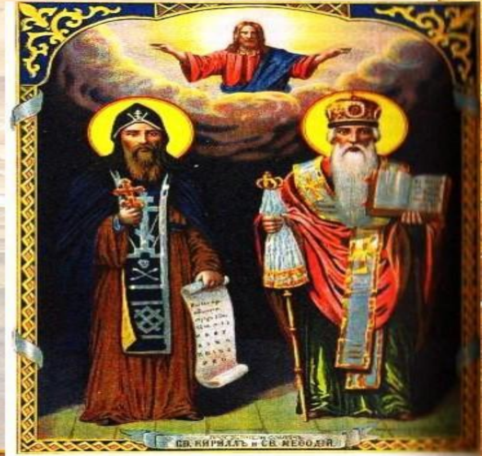
Братья из Солуни Кирилл и Мефодий, славянские просветители, создатели славянской азбуки. Хромонография. 1914 г.