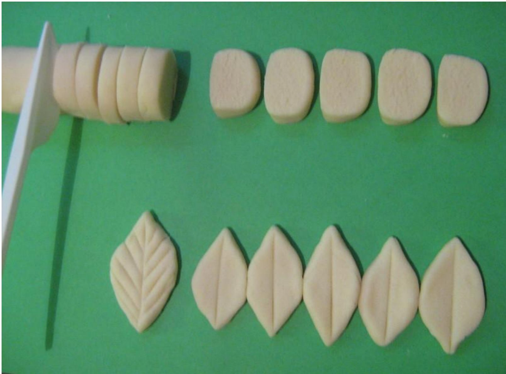
Технология изготовления листика