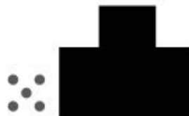
ПУЛИ УЙДУТ ВЛЕВО