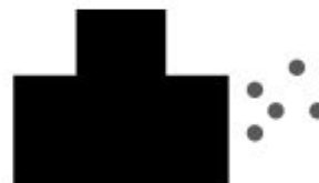
ПУЛИ УЙДУТ ВПРАВО