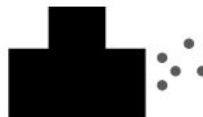
ПУЛИ УЙДУТ ВПРАВО