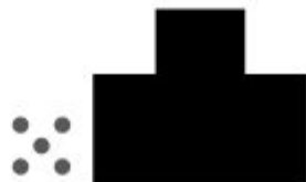
ПУЛИ УЙДУТ ВЛЕВО