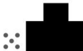
ПУЛИ УЙДУТ ВЛЕВО