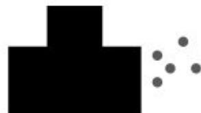
ПУЛИ УЙДУТ ВПРАВО