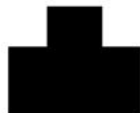
ПУЛИ УЙДУТ НИЖЕ