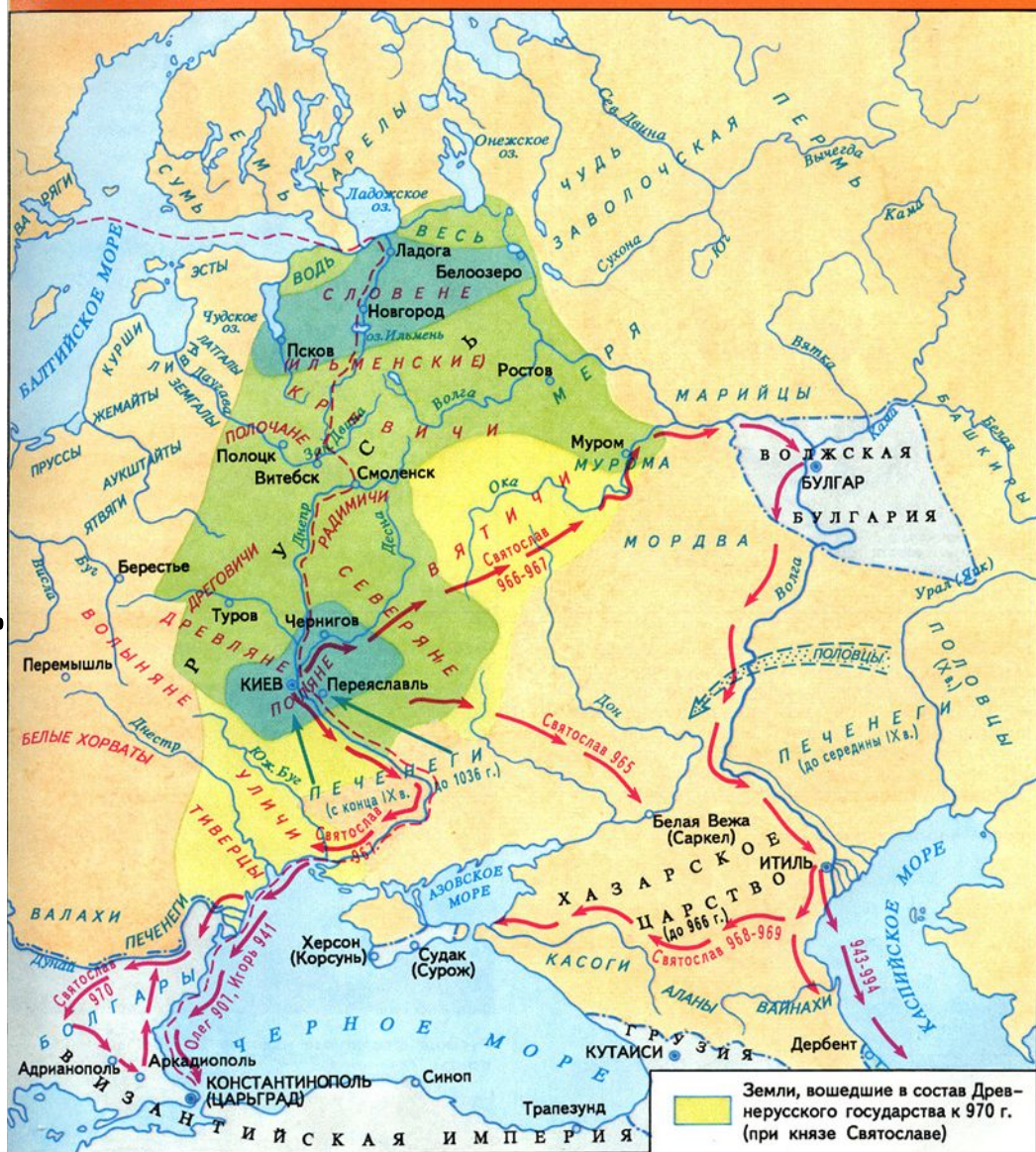
РУСЬ В IX – X вв.