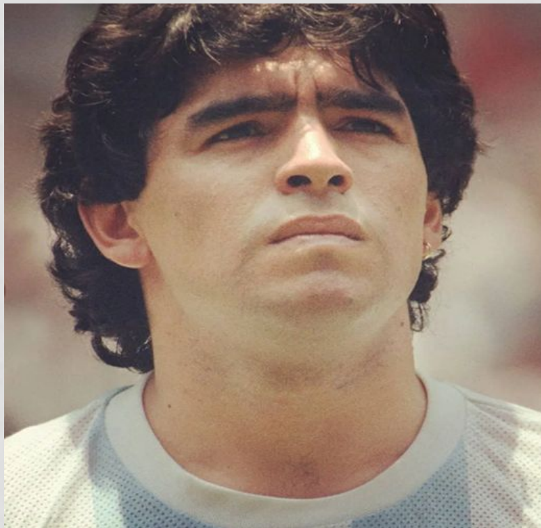
Диего Марадона, футбол.