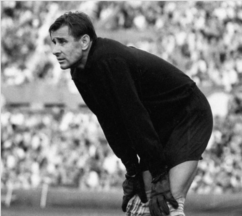
Лев Яшин, футбол