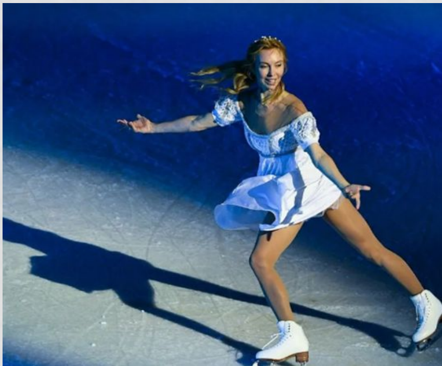
Елена Бережная, фигурное катание.