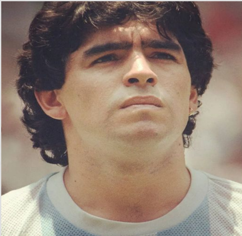
Диего Марадона, футбол.