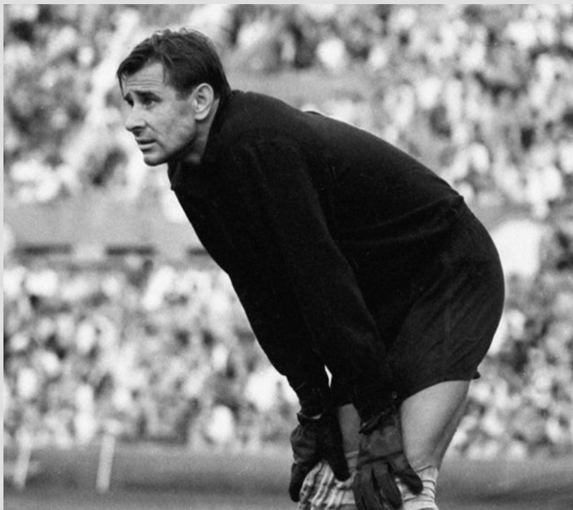
Лев Яшин, футбол