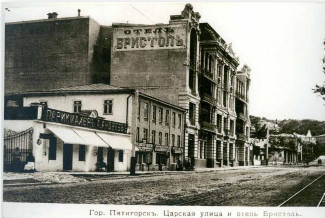
Гор. Пятигорскъ. Царская улица и отель Бристолю.

Пятигорск по праву называется старейшиной Кавминвод. Ведь он, как местность с лечебными источниками, был известен еще в глубокой древности. Античные авторы писали о том, что некоторые народы Северного Кавказа ставят в свои захоронения кувшины с исцеляющей водой в надежде, что она поможет усопшему вернуться к жизни.