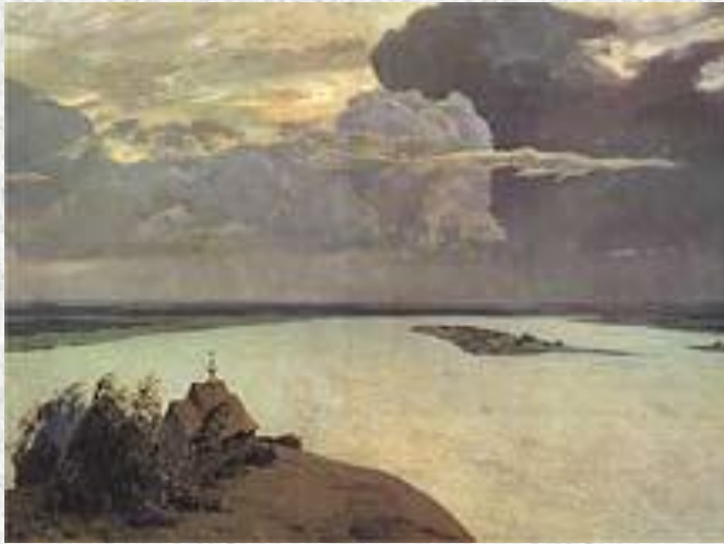
И.Левитан. Над вечным покоем.