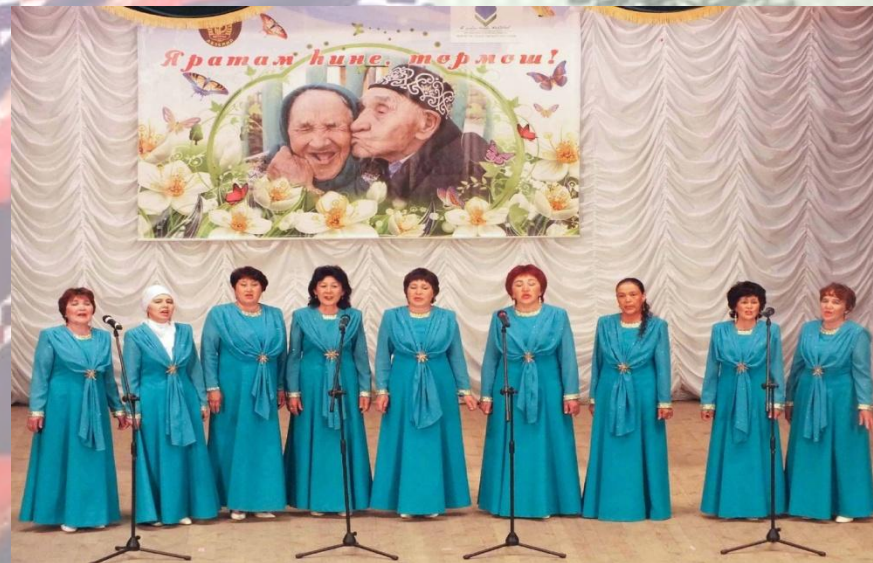
«Гөлдәр» халык вокал ансамбле