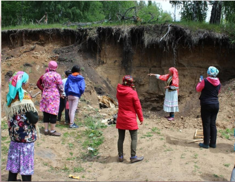
“Кирбес һуғы» өмәһе