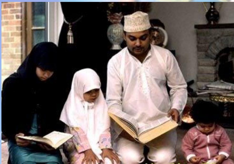
Человек в религиозных традициях мира