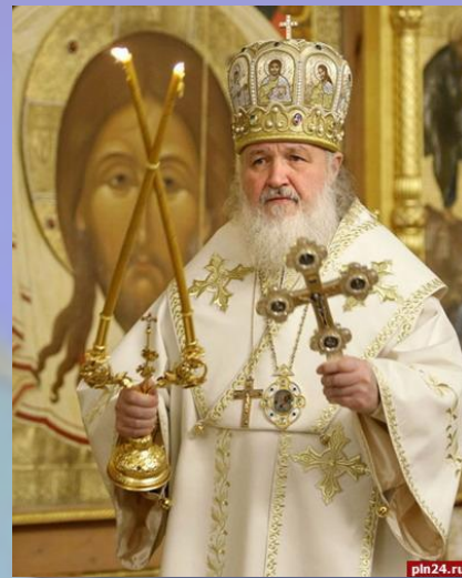
Святейший Патриарх Московский и всея Руси Кирилл