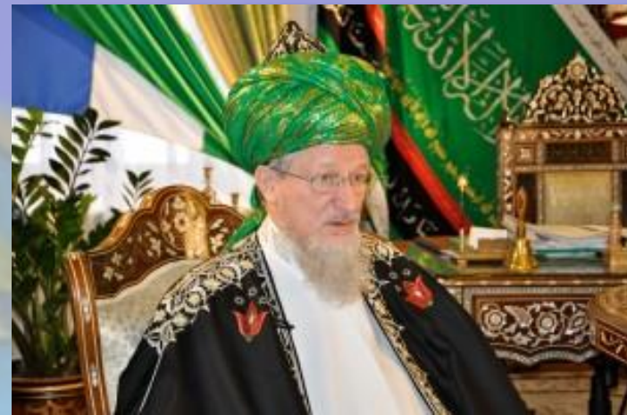
Верховный муфтий России и стран СНГ Талгат Таджуддин