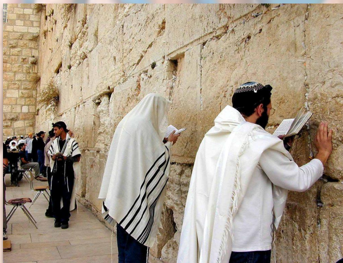
Человек в религиозных традициях мира