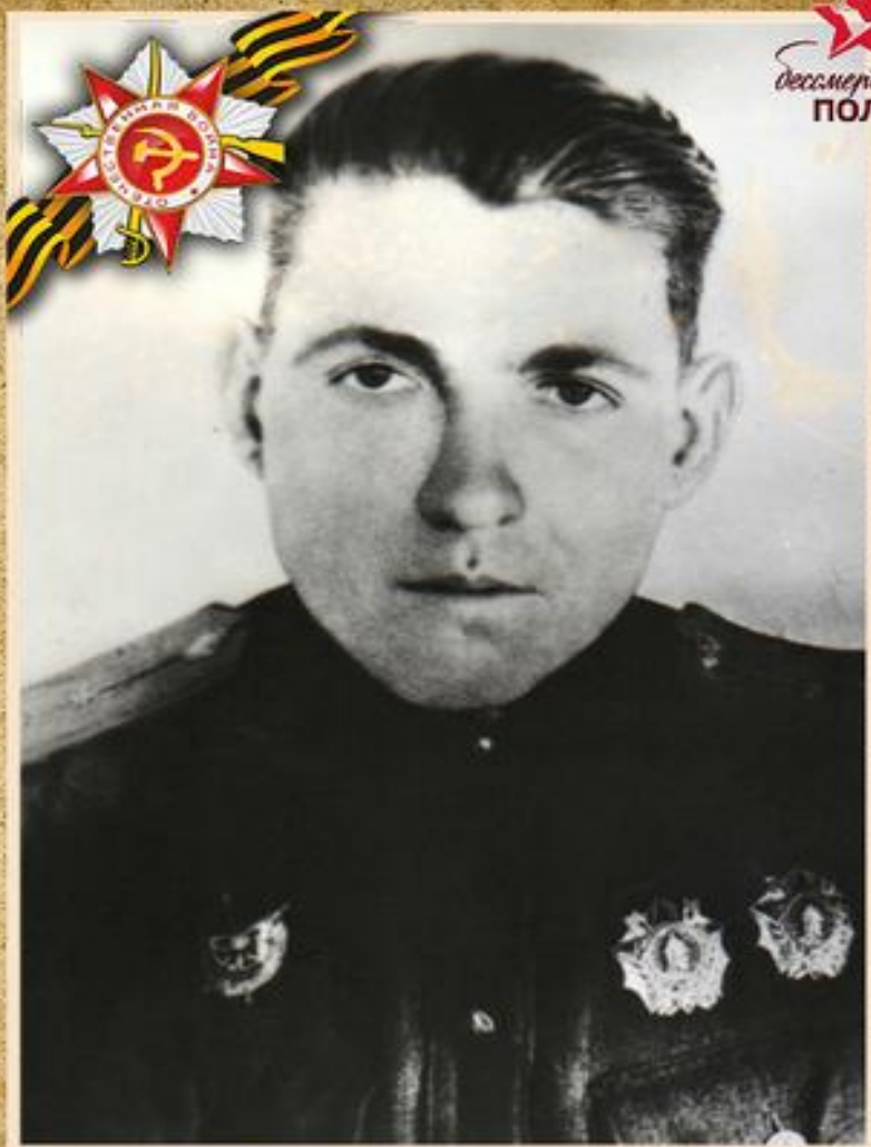
Горбунов Николай Иванович лётчик Герой Советского союза

Н.И. Горбунов (15. 01. 1918 -19.05.1944 гг)