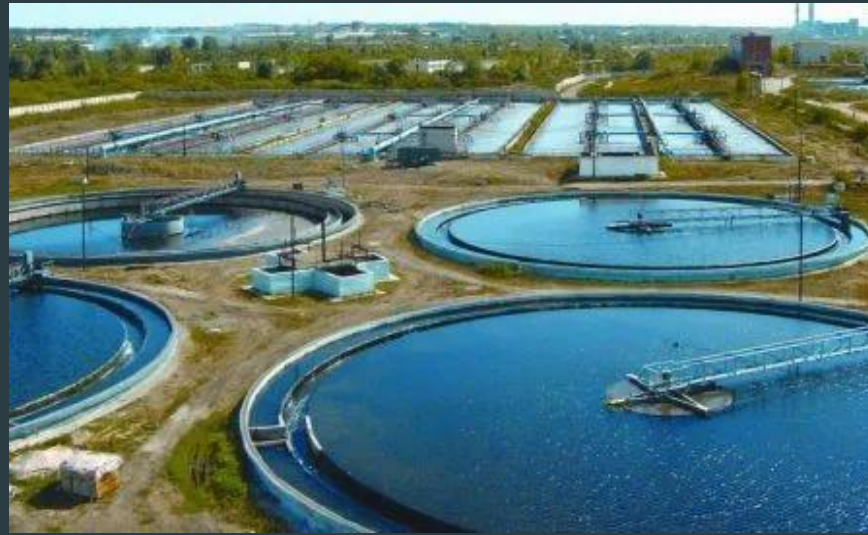
Очистные сооружения воды