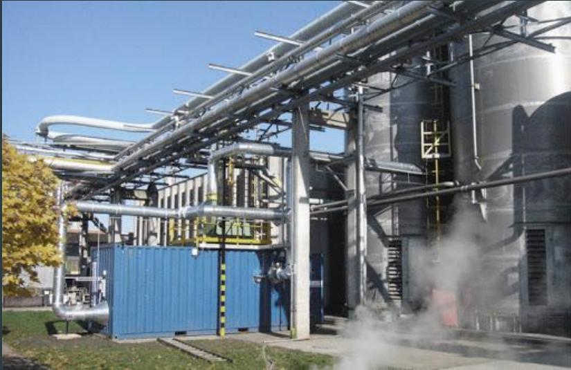
Очистные сооружения воздуха