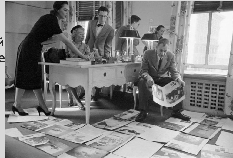
Редакция Harper's Bazaar