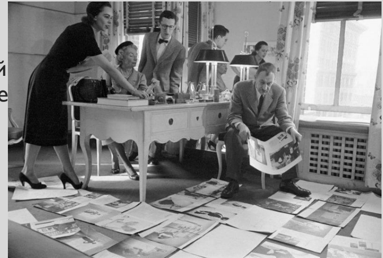
Редакция Harper's Bazaar