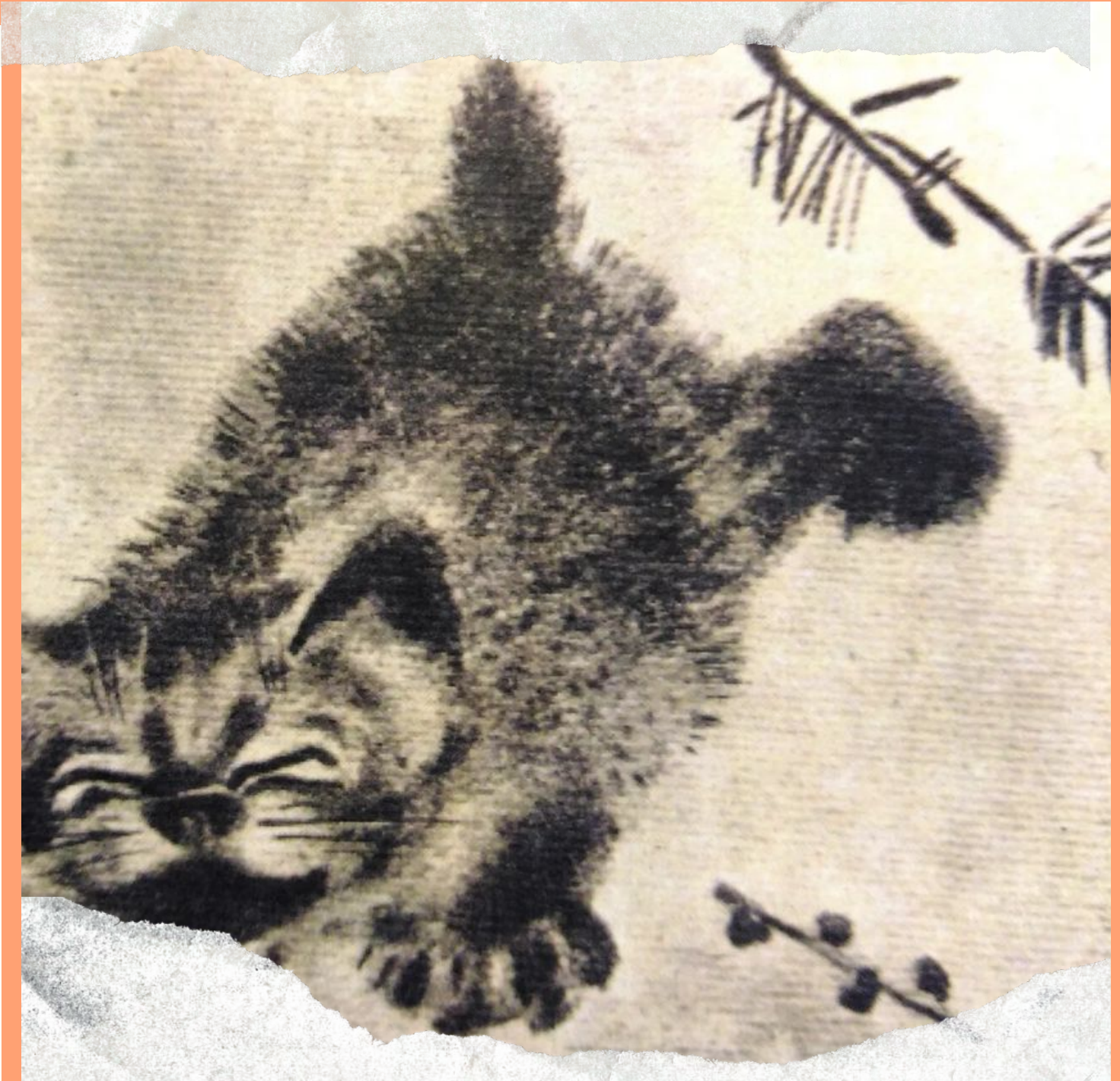
Иллюстрация Евгения Чарушина к рассказу Виталия Бианки "Мурзук". Главный герой рассказа - маленький рысёнок