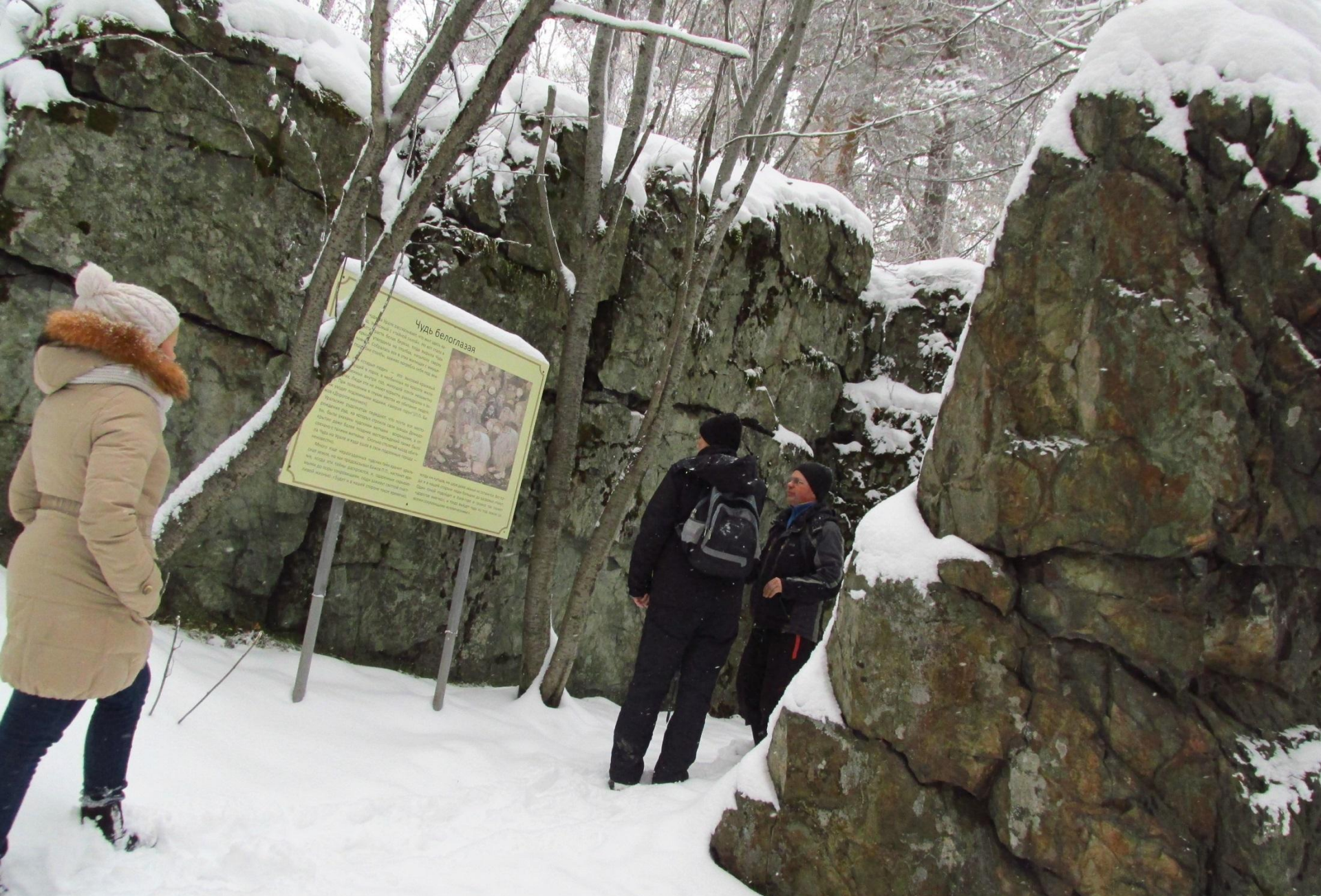
Дом Чуди белоглазой