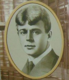
Есенин Сергей Александрович 1895 - 1925