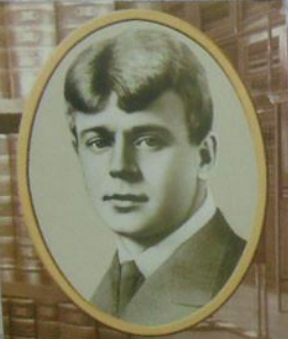
Есенин Сергей Александрович 1895 - 1925