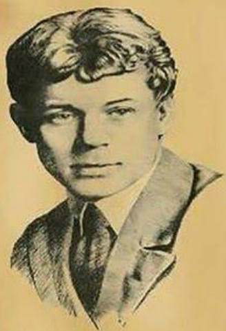
С. А. Есенин

Вечером синим, вечером лунным Был я когда-то красивым и юным. Неудержимо, неповторимо Все пролетело. Далече... мимо... Сердце остыло, и выцвели очи... Синее счастье! Лунные ночи!