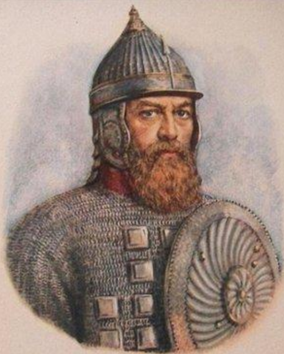
Дмитрий Пожарский 1578 – 1642