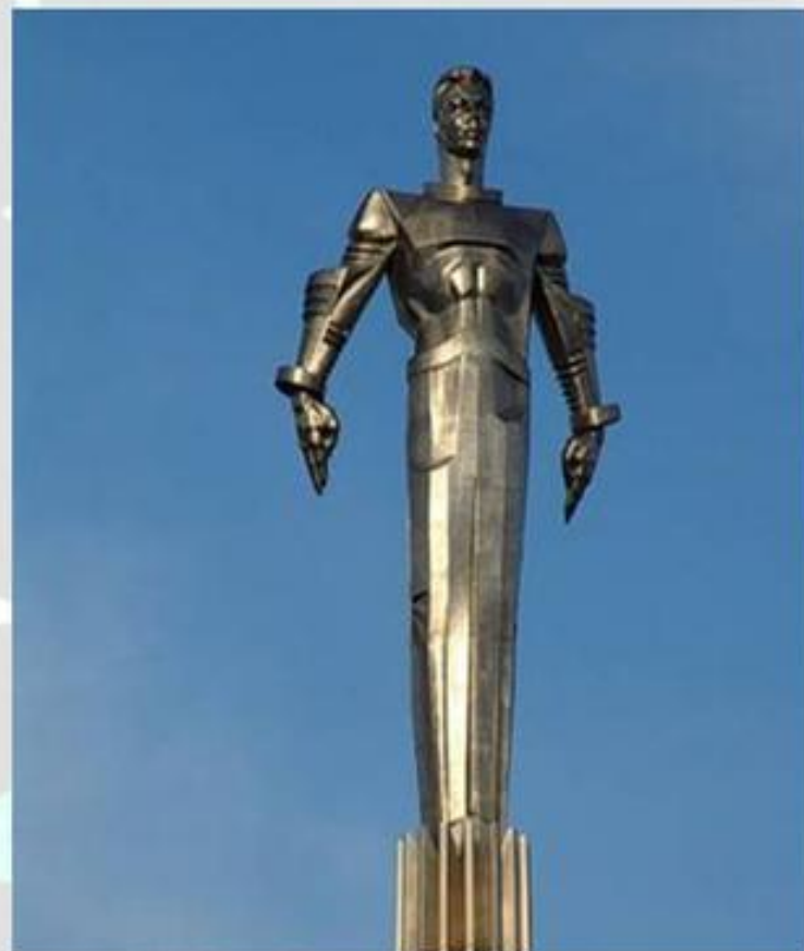
Памятник Ю. Гагарину в Москве