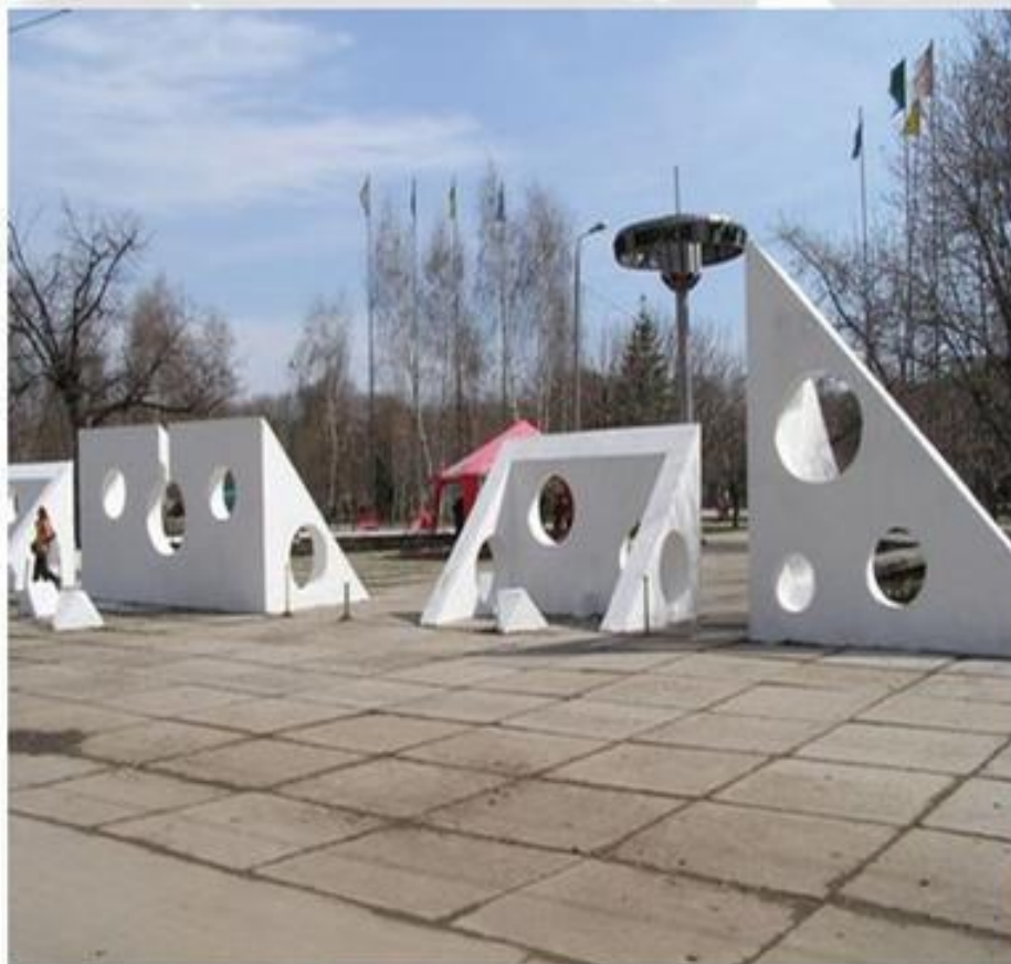
Парк им. Ю. Гагарина в Самаре

Во многих городах России и других стран существуют улицы, проспекты, площади, бульвары, парки, клубы и школы имени Гагарина.