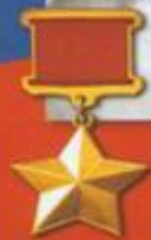
ГАГАРИН Юрий Алексеевич лётчик-космонавт СССР