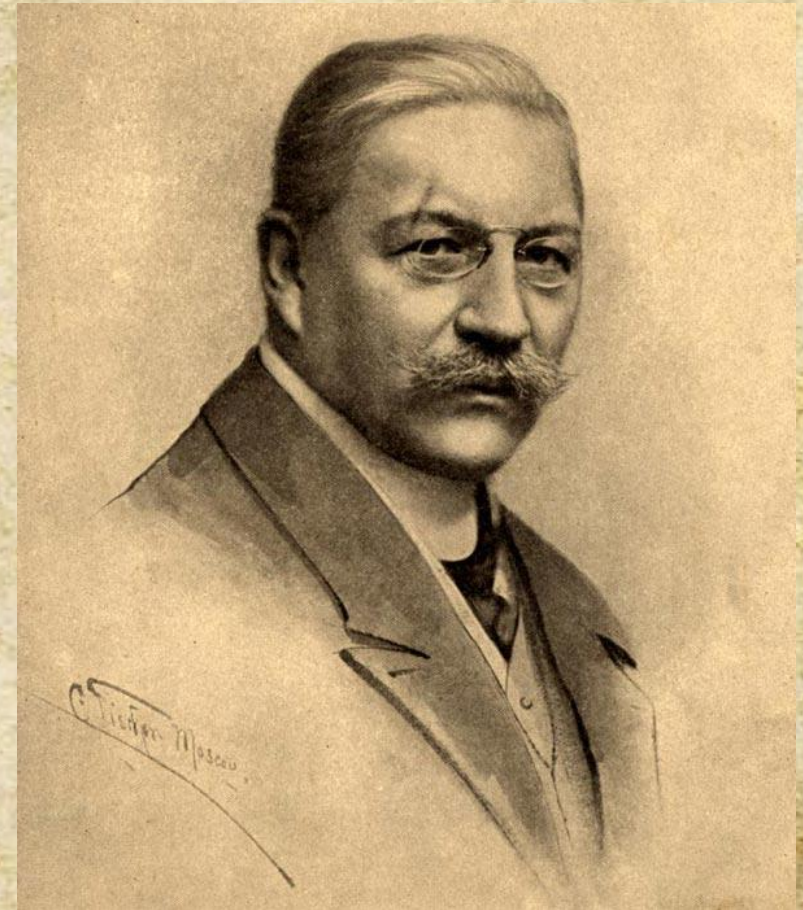
Павел Николаевич Милуков