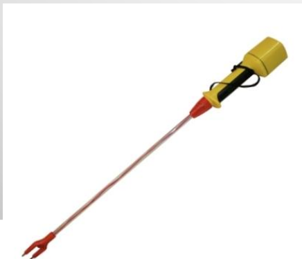
Электропогонялка для скота