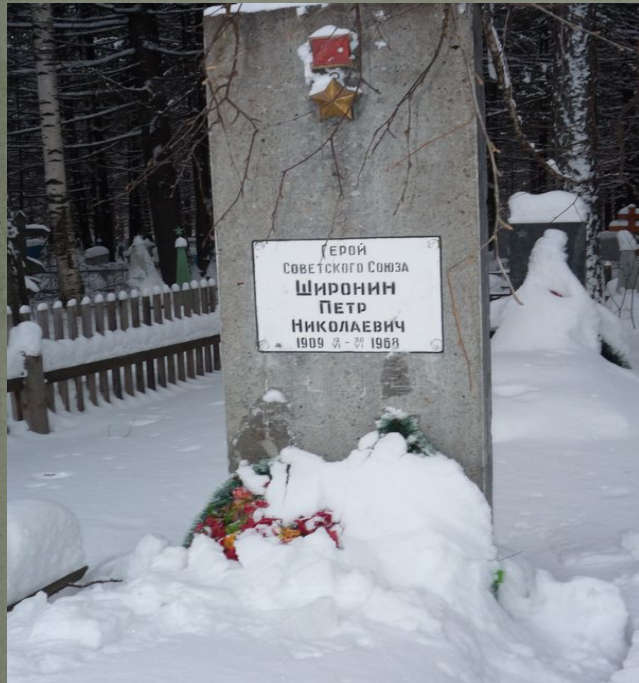
Могила П.Н. Широина г. Кирс Январь 2015 г.