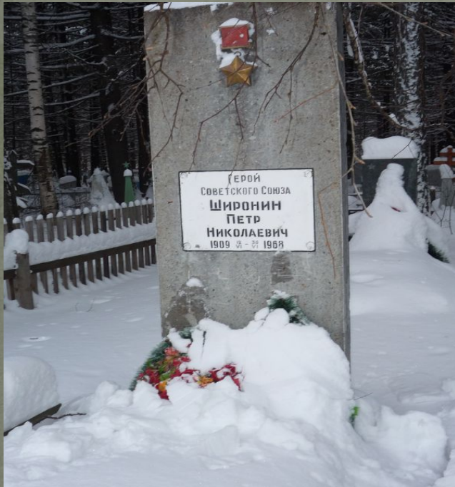
Могила П.Н. Широина г. Кирс Январь 2015 г.