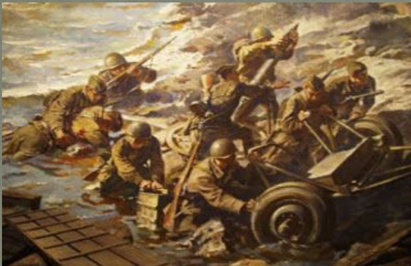
Красноармейцы форсируют Днепр