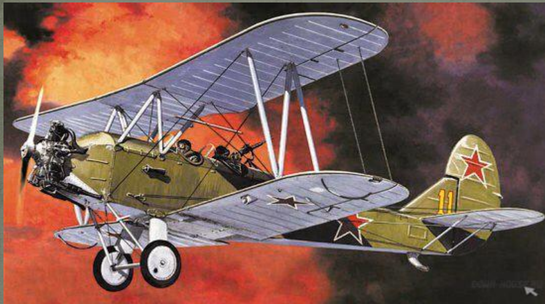
Самолет По-2 на котором летал Цылев П.Н