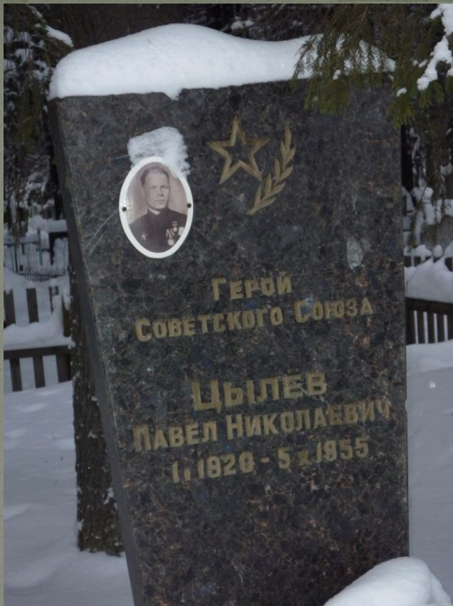
Могила П.Н. Цылева г. Кирс Январь 2015