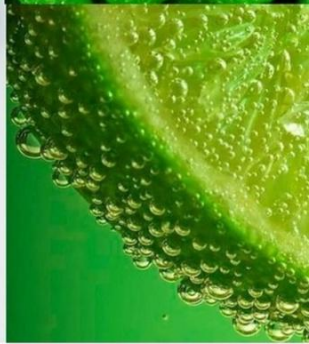
«ГОЛУБАЯ ГАВАНЬ» (HARBOR BLUE)