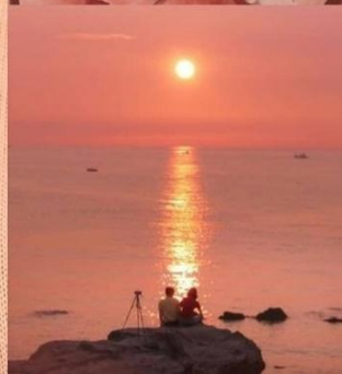
«ПРОЗРАЧНЫЙ РОЗОВЫЙ» (GOSSAMER PINK)