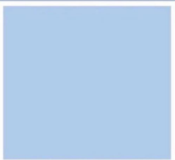
PANTONE® 13-4014 TSX Whispy Blue