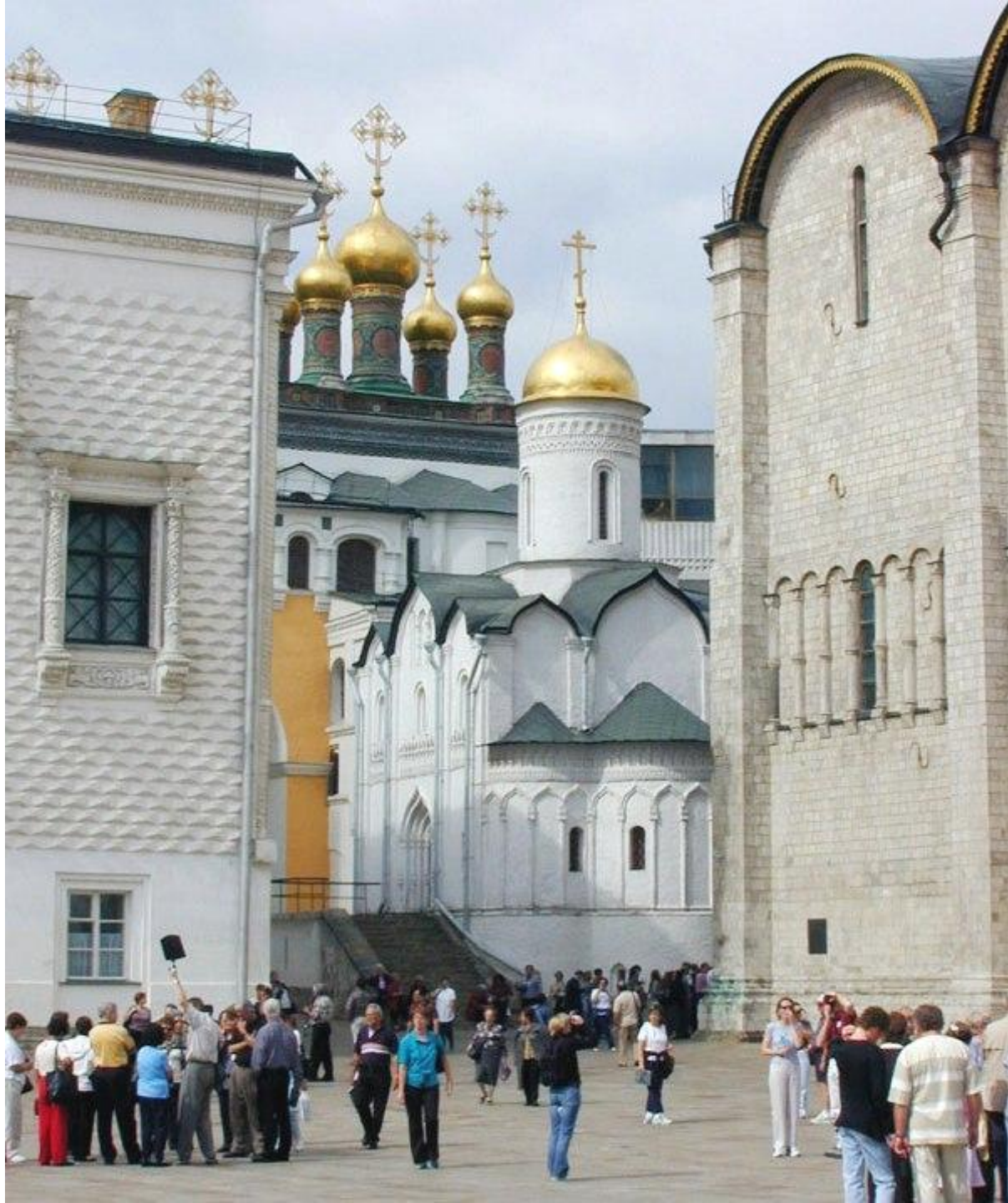
Церковь Ризоположения 1484-86. Домовая церковь митрополита московского