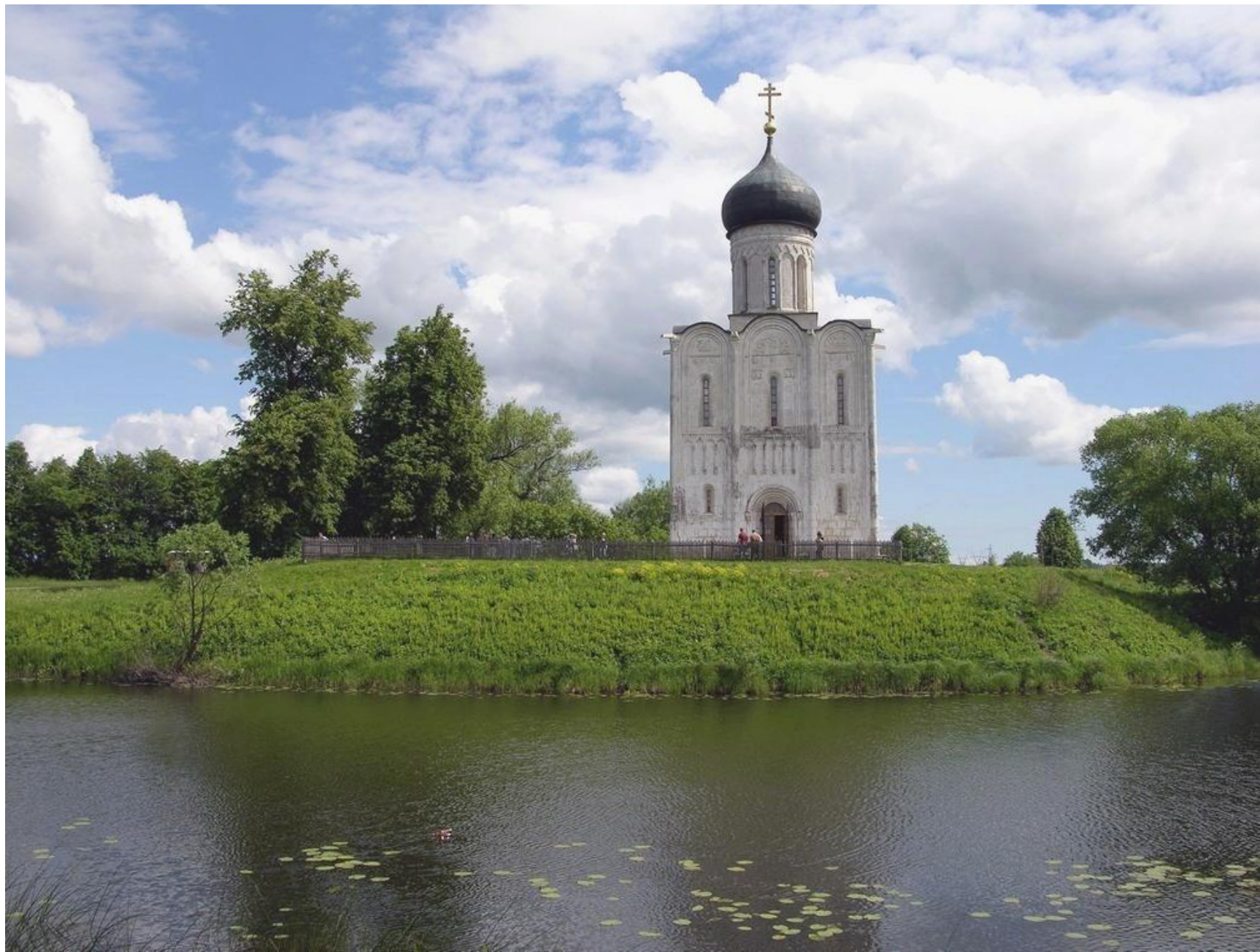
Церковь Покрова на Нерли, 1165 г.