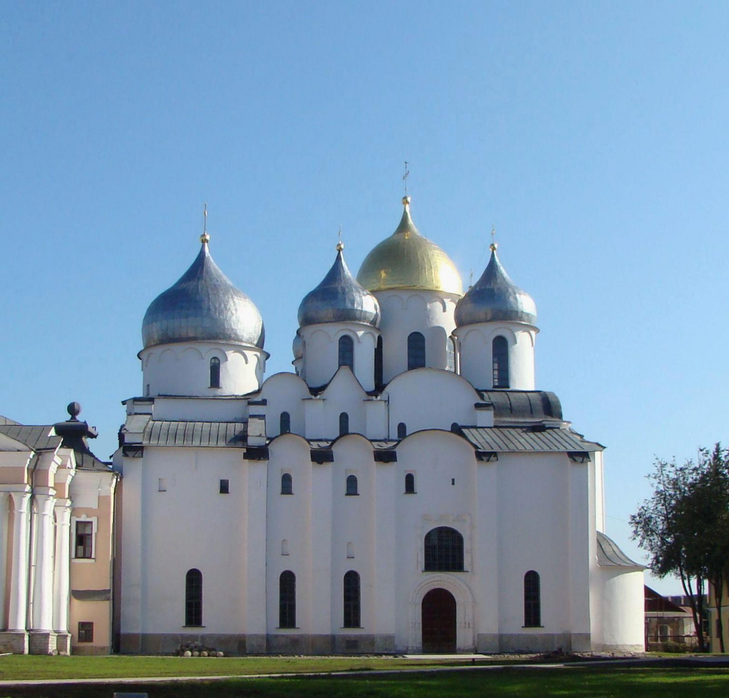
Софийский собор в Новгороде 1045-55 гг.