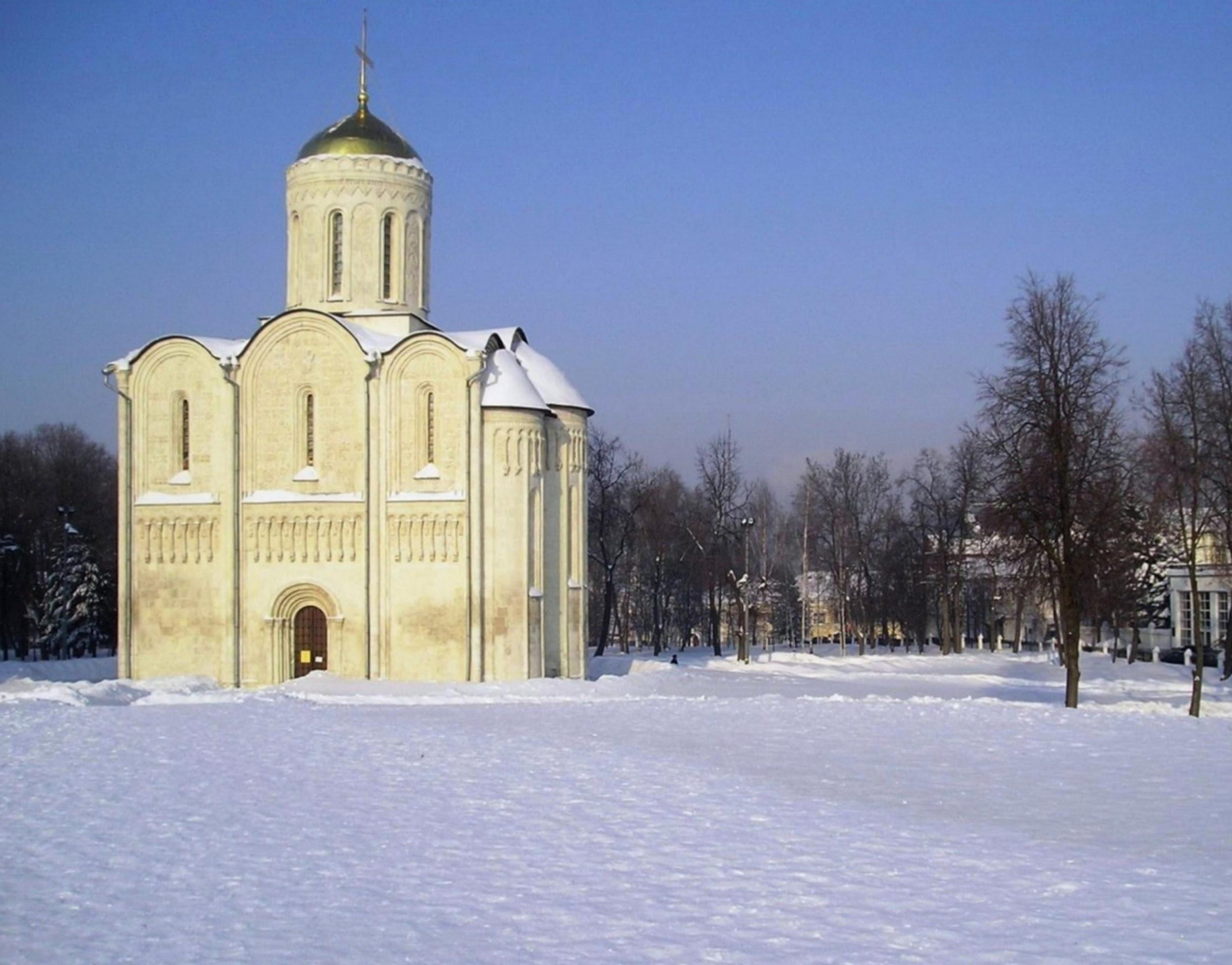
Дмитриевский собор, 1193-97 гг.