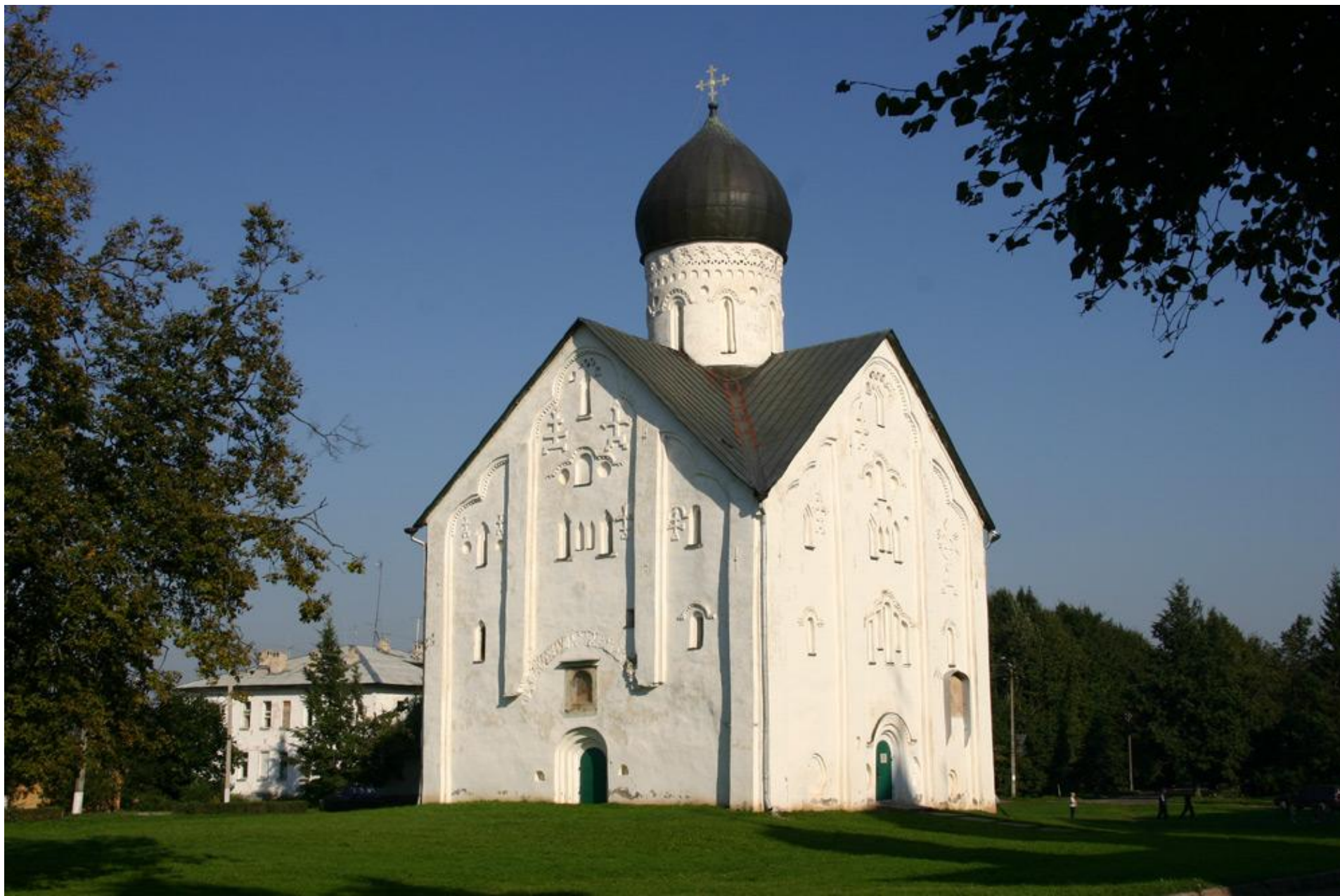
Церковь Спаса на Ильине улице 1374 г.