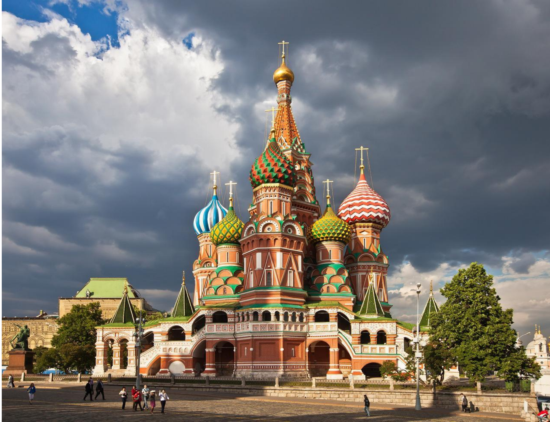
Собор Покрова на Рву или собор Василия Блаженного. Архитекторы Барма и Постник Яковлев (возможно, Иван Яковлевич Барма), 1555-61.