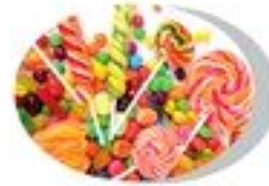
Конфеты/Сахар/ Жевательная резинка