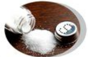
Соль (в больших количествах)