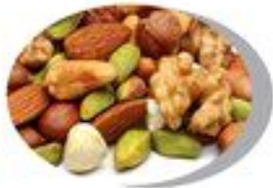
Орехи Макадами/Мускатный орех/ Грецкий орех