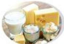
Молочные продукты (в большом количестве)