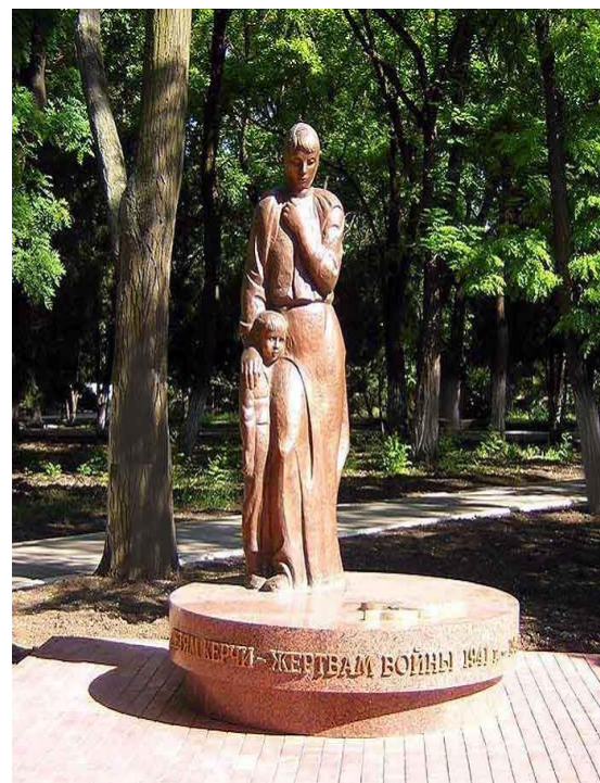
Памятник детям - жертвам войны.