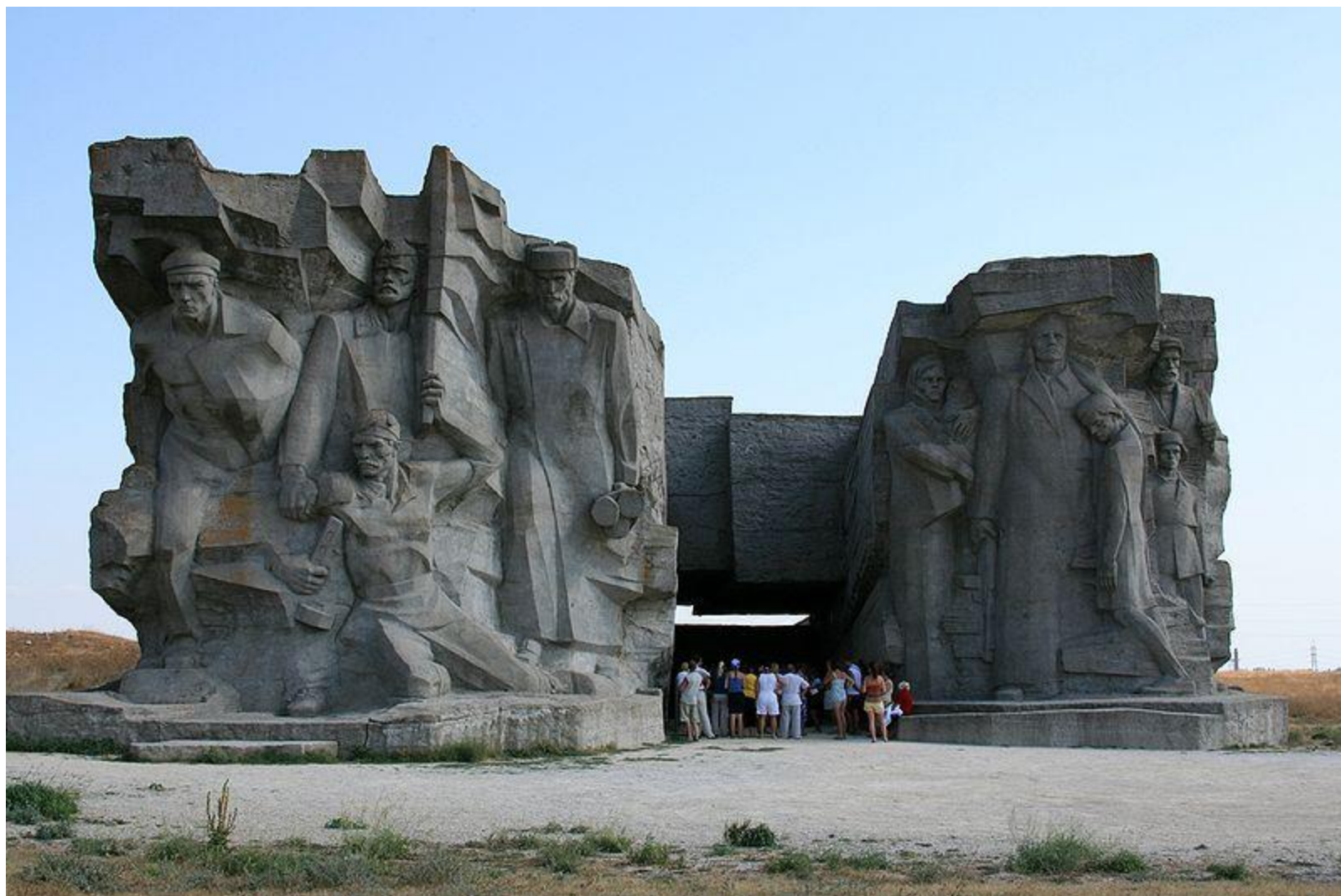
Композиция над музеем обороны Аджимушкайских каменоломен