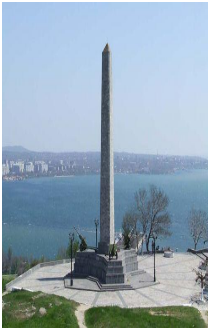
Обелиск Славы в Керчи.