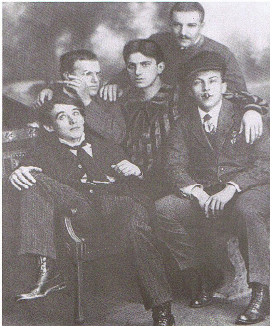
23. Группа футуристов. Слева направо: А. Крученых, Д. Бурлюк, В. Маяковский, Б. Лившиц, позади Н. Бурлюк. 1913. Фото.