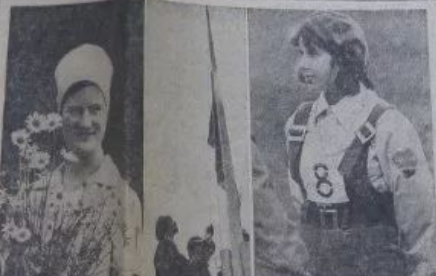
Легла прямая борозда

В Волгодонской области, в районе станции Волгодон, шахта работала в полную силу. Шахте нужна была рабочая сила. Шахте нужна была рабочая сила.