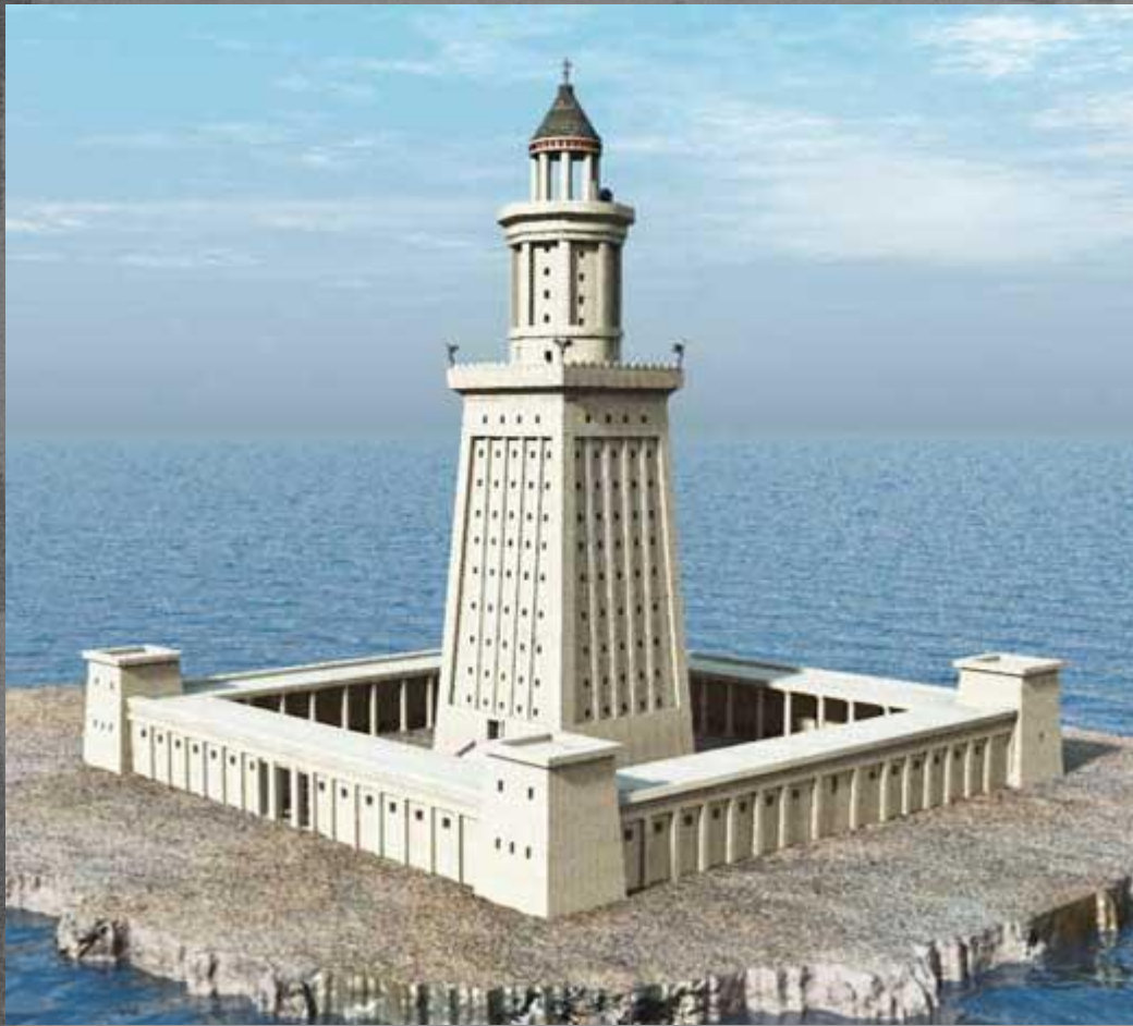
Александрийский маяк (Сострат Книдский)