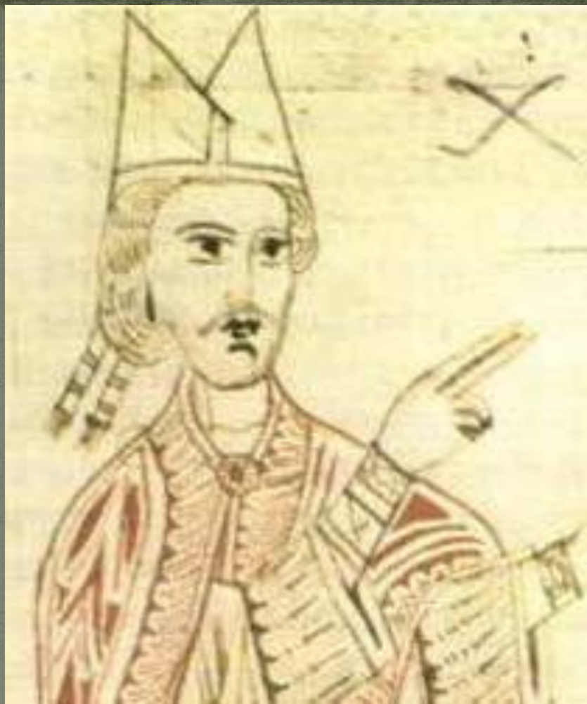
Папа римский Григорий VII