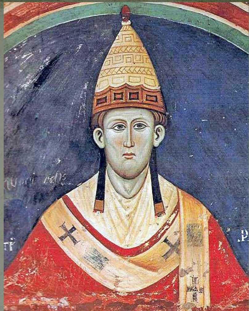
Папа римский Иннокентий III