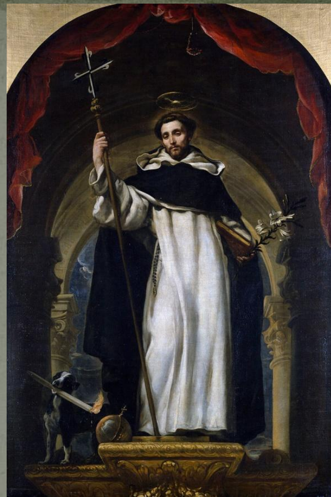
Святой Доминик и символ Ордена доминиканцев (справа)