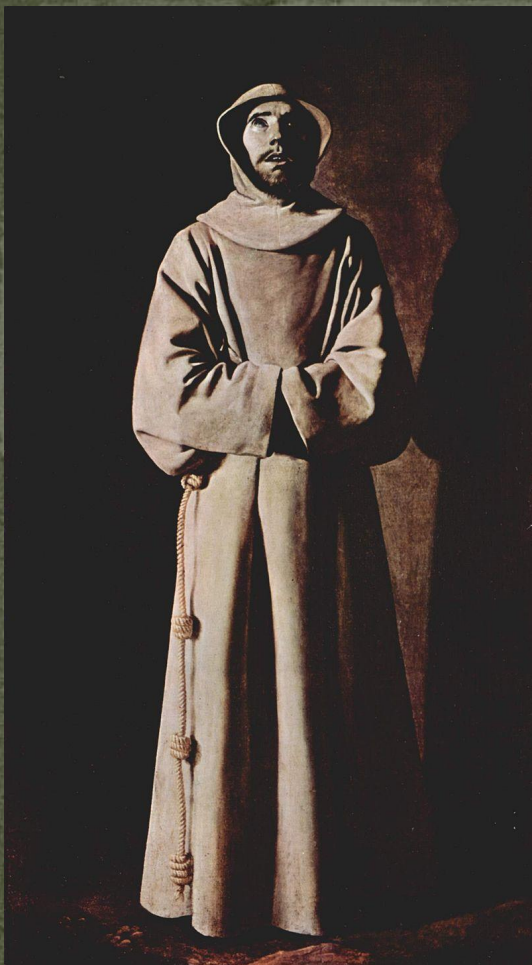
Святой Франциск и символ Ордена францисканцев (слева)