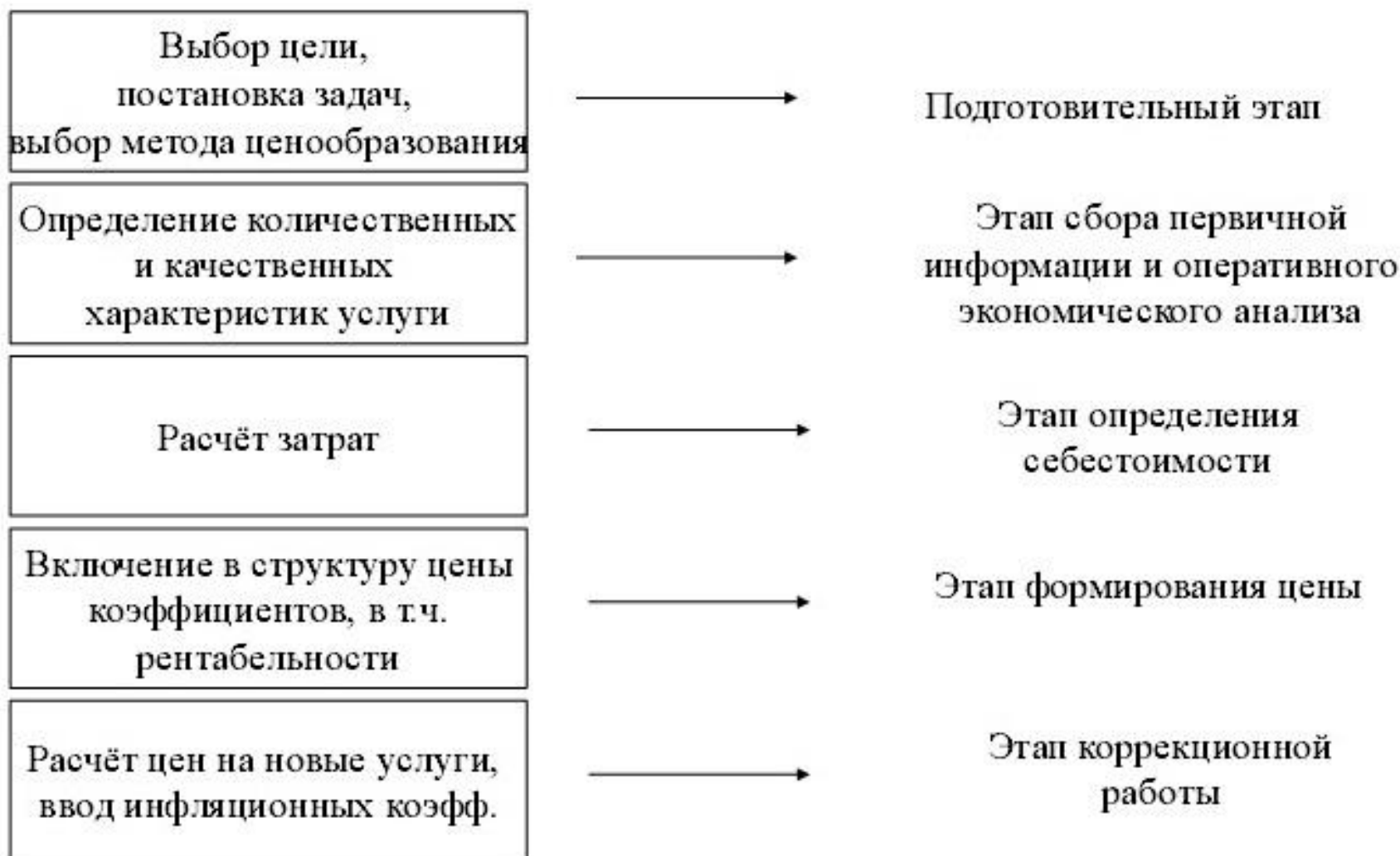
Схема процесса установления цен