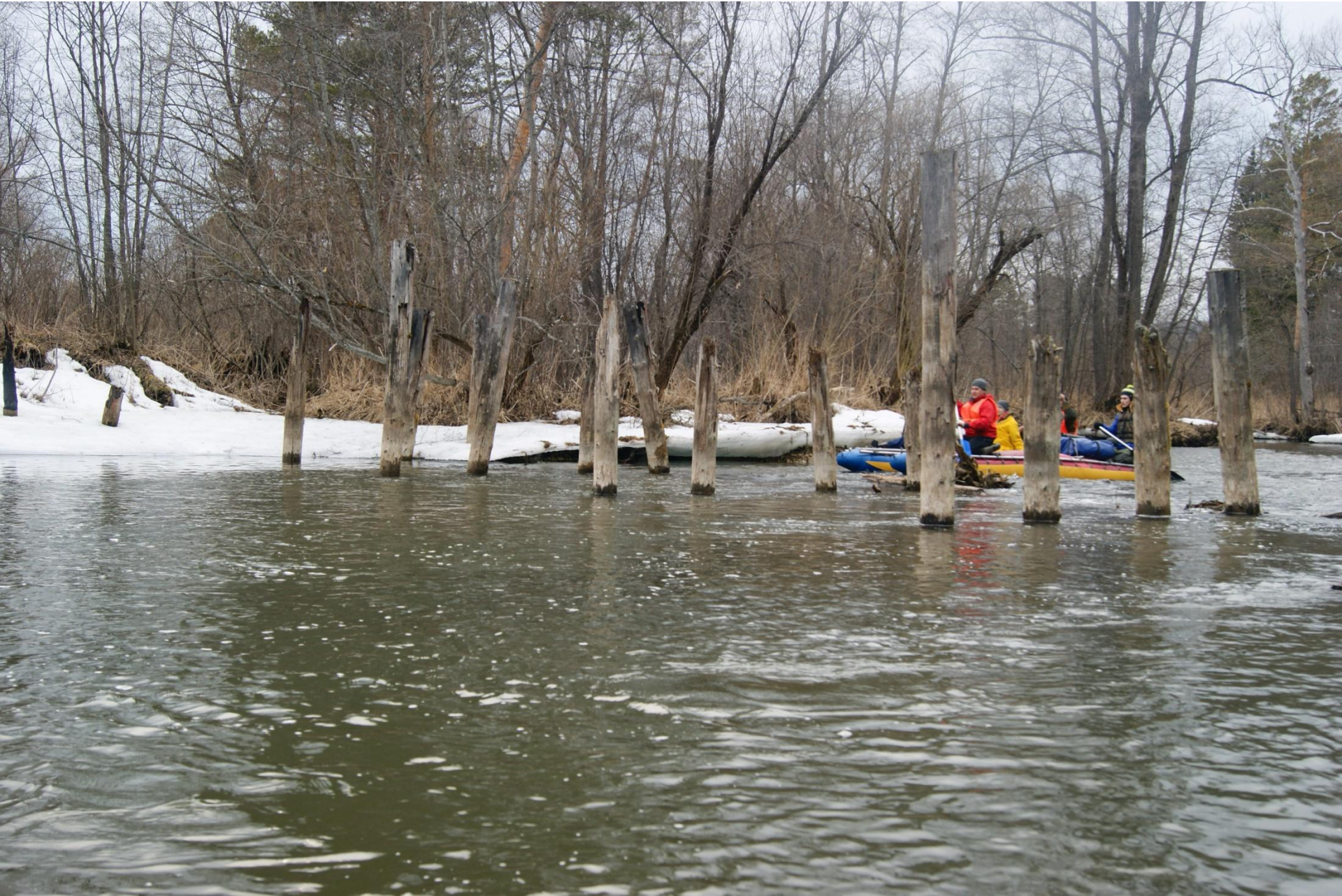
В районе Аликаева камня, чуть ниже по течению остались сваи старого моста.