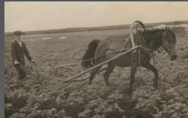
Фото: Верная помощница крестьянина – лошадка.