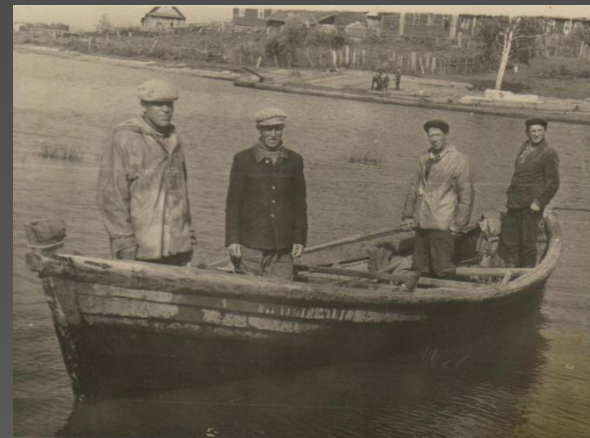
Фото.: Возвращение из озера.

○ Современный весенний лов нерестового снетка на озере Белом производится ризцами и курляндками - - вентерями, более крупными и более уловистыми, чем былые «частушки». О значении вентерного лова в общих уловах снетка па озере можно судить по следующим данным: В послевоенные годы большие уловы снетка па озере Белом получены в 1946 г. и 1951 г. В 1946 г., из общего улова снетка 4,3 тыс. ц, ризцами весной добыто 3 тыс. ц, то есть 70%, что объясняется высокими урожаями снетка в 1944 и 1945 гг. В последние годы вылов снетка вентерями на озере постепенно возрастает, по значение вентерных уловов в общих уловах этой рыбы сокращается из-за усиления промысла снетковыми тралами. Внедрение в промысел снетка крупных уловистых вентерей позволило рыбакам отказаться от применения большого количества «частушек», облегчило установку и осмотр ловушек на озере.