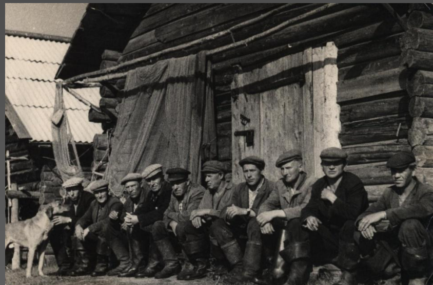
Фото: Группа рыбаков колхоза «Ударный рыбак».

○ В своей работе мне удалось рассказать о многих сторонах хозяйственной деятельности колхоза «Ударный рыбак».