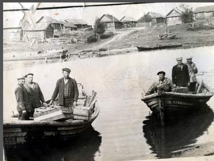
Фото.: Возвращение из озера.

Главным источником моей работы является книга Т.С.Шевелёвой «Записки колхозника», изданной в селе Липин Бор в 2018 году. Ценность этой книги заключается в том, что она написана на основе архивных документов. Главным источником для данной книги явились «Протоколы общих собраний правления колхоза «Ударный рыбак» за 1954 -1959 гг.» Так оказалось, что это единственные документы о колхозе «Ударный рыбак», сохранившиеся в Вашкинском районном архиве.