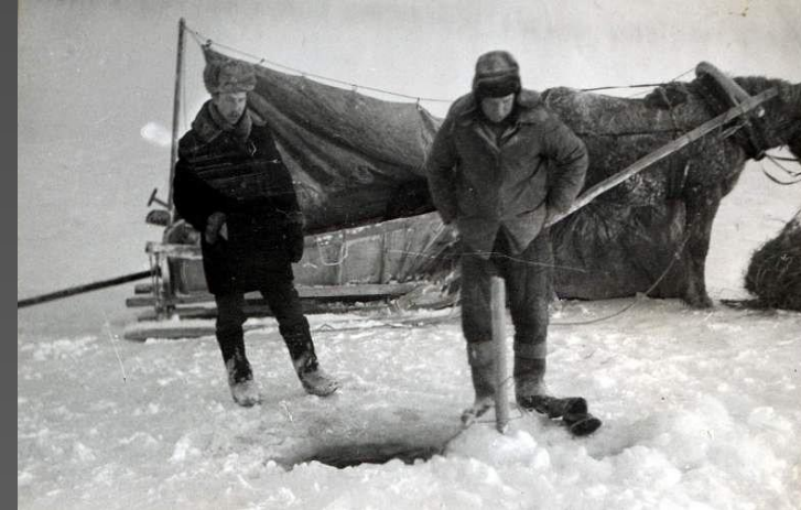
Фото: Зимний лов.

Самым распространённым методом лова во время навигации является ловля рыбы тралом. Траловый лов на озере Белом производится как днём, так и ночью. Замечено, что в летние месяцы добычливее ночной лов. Этот метод вначале широко применялся на парусных рыбацких лодках, а затем он был механизирован, на смену парусу пришли моторы. После войны, в 1945—1948 годах, на озере только две пары моторных судов занимались траловым ловом. Постепенно число траловых судов увеличивалось, появлялись суда более сильные (с мощностью двигателя 80 лошадиных сил. с.), чем мотоботы (40 л. с.), на которых выполнялся близнецовый лов. Траловые рыболовные суда могли производить траление в одиночку. В 1954 году среди всех видов лова траловый уже занимает первое место — уловы тралами составили около 50% общего годового улова. Большое значение в уловах имеют также чехонь и судак, а при одиночном лове - ещё уклея. Из крупной рыбы улавливается только судак...Насколько велик прилов так называемого «крупного ерша», можно судить по следующему примеру: рыбаки колхоза «Ударный рыбак» только за сентябрь 1950 г. вы ловили одиночными тралами 1248 кг «ерша», в том числе «крупного ерша» 499 кг, или 35%..»