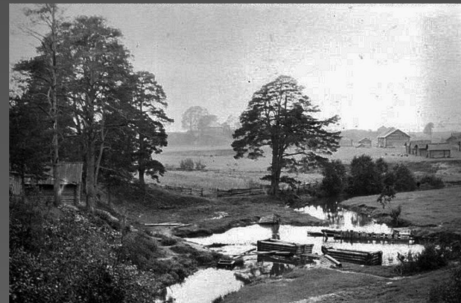
Фото: Плотина на реке Боровка (напротив старой коммунальной бани).