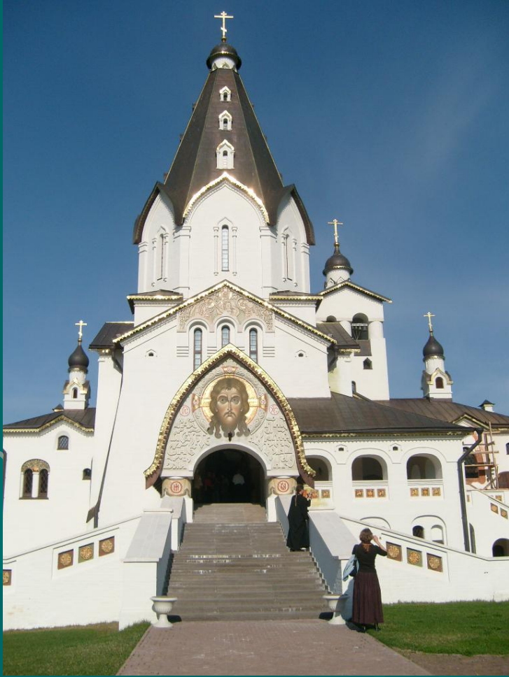
Владимирский скит, о. Валаам

«Мы одно любим, одного желаем: любим Отчество; желаем благоденствия еще более, нежели славы; желаем, да не изменится никогда основание нашего величия ... да цветет Россия... по крайней мере долго, долго, если на земле нет ничего бессмертного, кроме души человеческой»