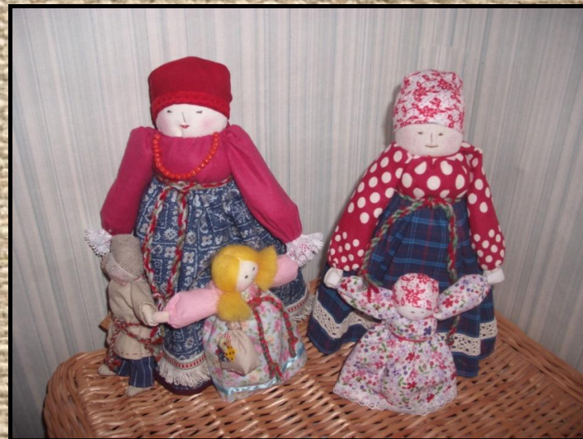
Скрутки – столбушки «Ведучки»