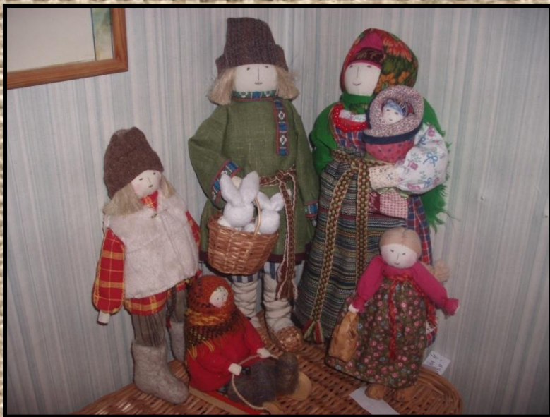
«Кукольные люди «Семья»