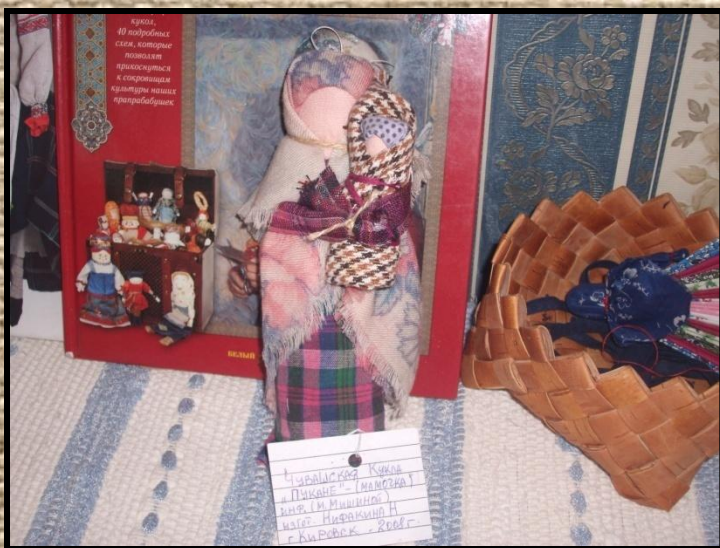
Чувашская кукла «Мамочка»