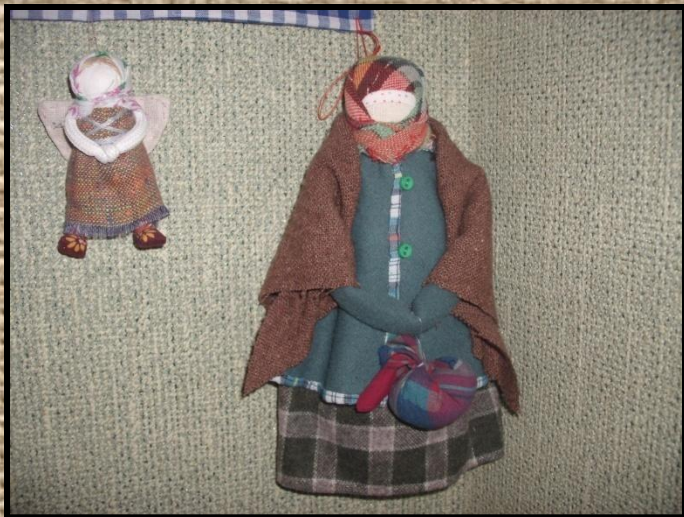
Вологодская «В шубейке»