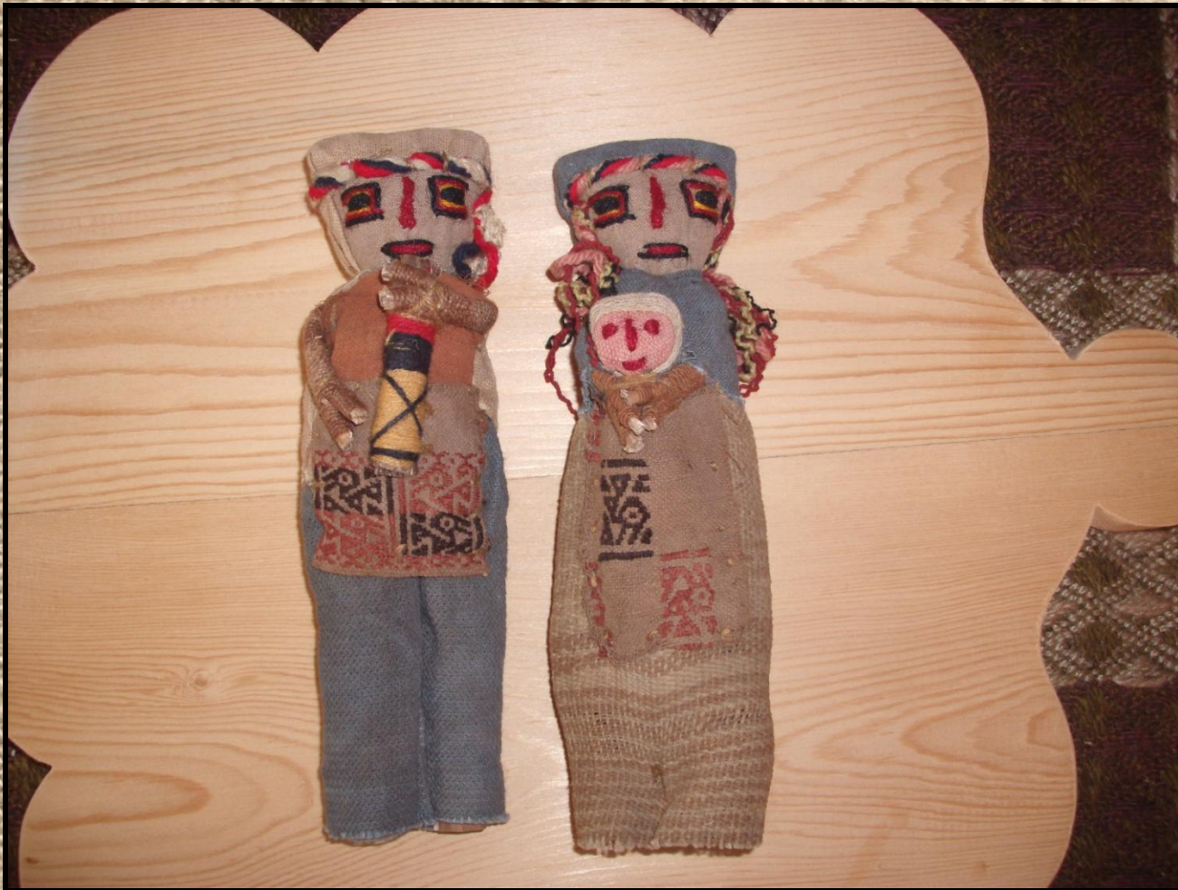
Куклы из Перу Южная Америка