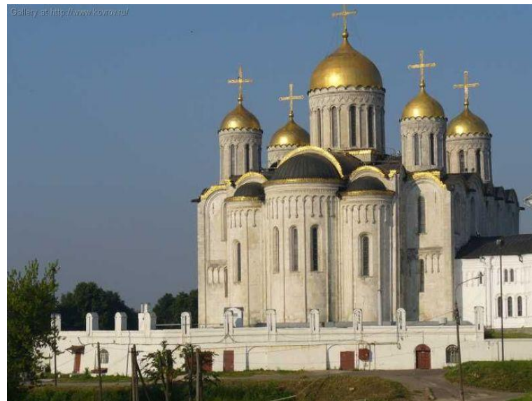
Успенский собор. Владимир