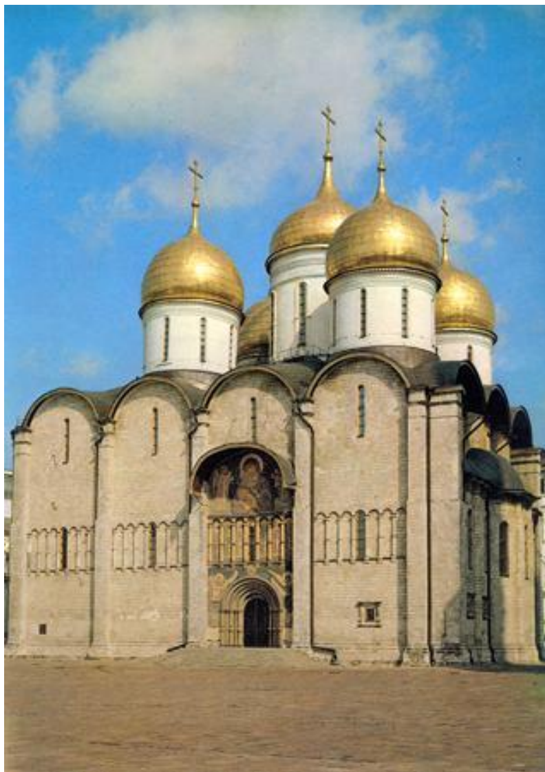
Успенский собор. Москва