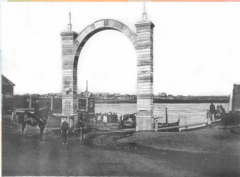
Гор. Маринскъ, Томской губ. Триумфальная арка.