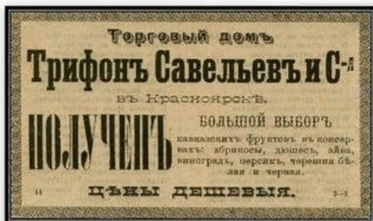
Торговая реклама Савельевых.