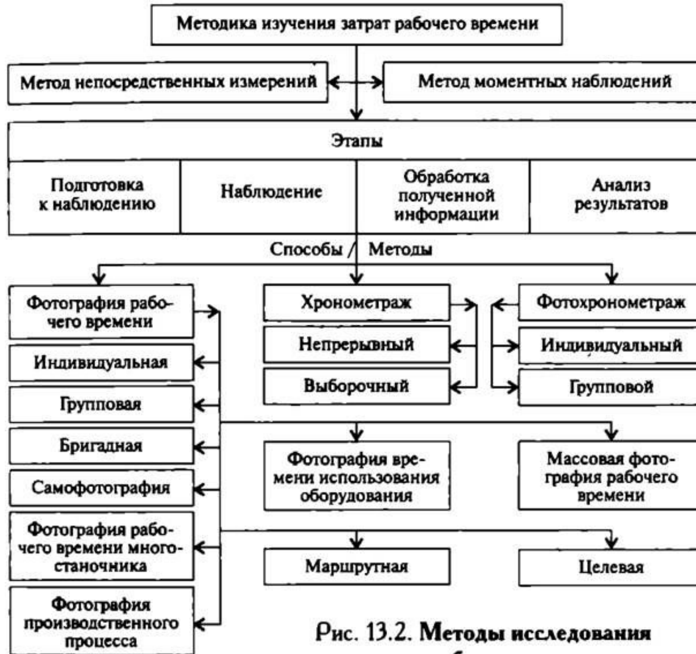
Рис. 13.2. Методы исследования затрат рабочего времени