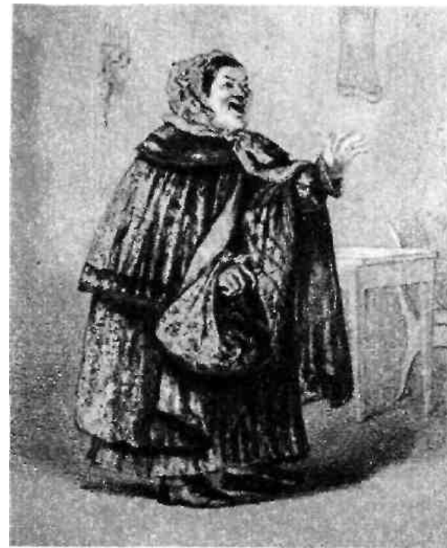
Сваха Устинья Наумовна. «Свои люди — сочтемся». С рисунка Я. Боклевского. 1859.