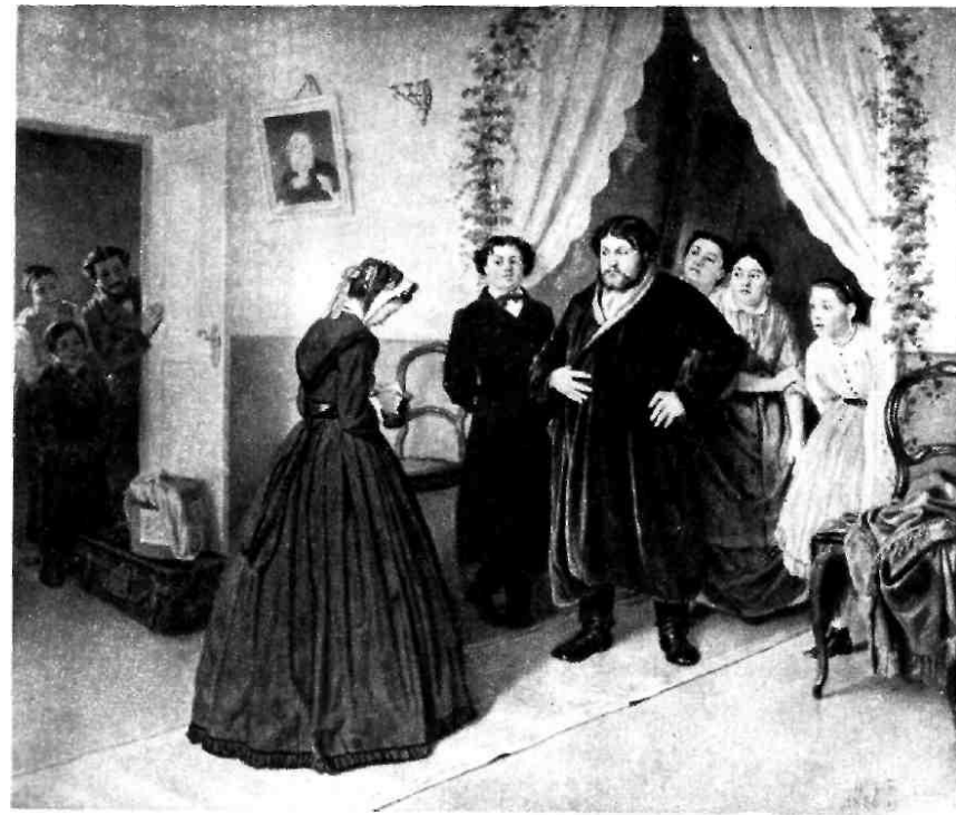
Приезд гувернантки в купеческий дом. С картины В. Перова. 1866.