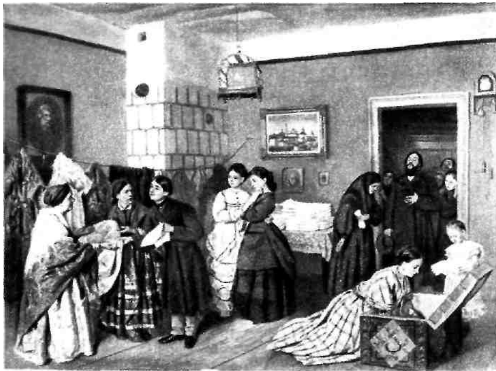
Прием приданого. С картины В. Пукирёва.

А. Н. Островский, с детства наблюдавший жизнь купцов, в совершенстве изучил быт, семейные и имущественные отношения их во время почти восьмилетней службы в Московском совестном, а затем Коммерческом суде, куда поступил по настоянию отца в 1843 году, не окончив университета.