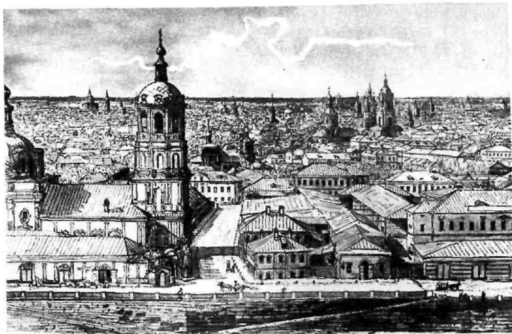
Замоскворечье. С литографии начала XIX века.

Александр Николаевич Островский родился 12 апреля (31 марта по ст. ст.) 1823 года в Москве, в Замоскворечье. Отец его служил в Московском коммерческом суде, выделяясь среди чиновников своим умом и начитанностью. Рано овдовев, он женился снова. Однако вторая жена не занималась детьми мужа от первого брака, поэтому будущий писатель все детство был предоставлен сам себе и рано пристрастился к чтению.