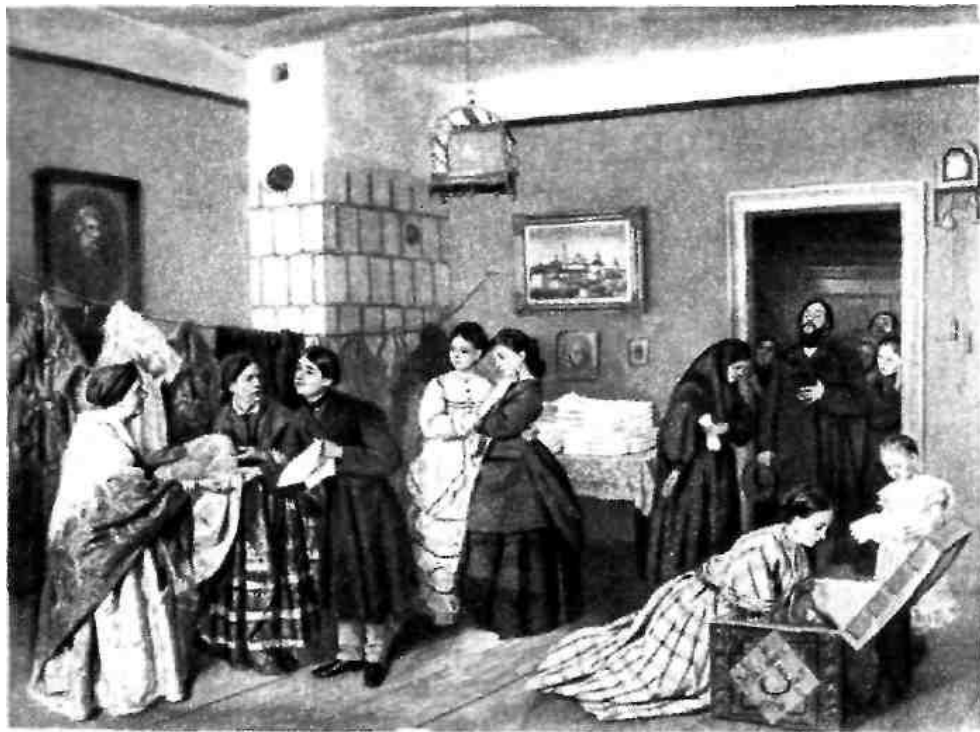
Прием приданого. С картины В. Пукирёва.

А. Н. Островский, с детства наблюдавший жизнь купцов, в совершенстве изучил быт, семейные и имущественные отношения их во время почти восьмилетней службы в Московском совестном, а затем Коммерческом суде, куда поступил по настоянию отца в 1843 году, не окончив университета.