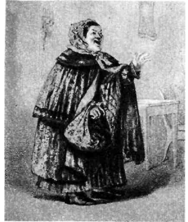
Сваха Устинья Наумовна. «Свои люди — сочтемся». С рисунка Я. Боклевского. 1859.