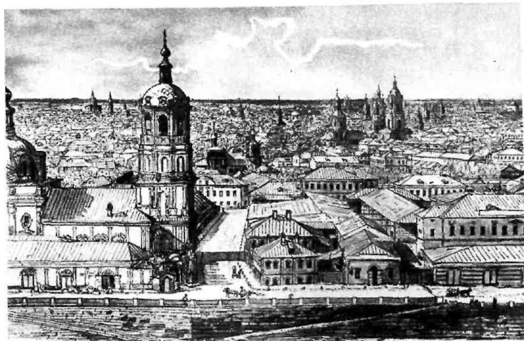
Замоскворечье. С литографии начала XIX века.

Александр Николаевич Островский родился 12 апреля (31 марта по ст. ст.) 1823 года в Москве, в Замоскворечье. Отец его служил в Московском коммерческом суде, выделяясь среди чиновников своим умом и начитанностью. Рано овдовев, он женился снова. Однако вторая жена не занималась детьми мужа от первого брака, поэтому будущий писатель все детство был предоставлен сам себе и рано пристрастился к чтению.