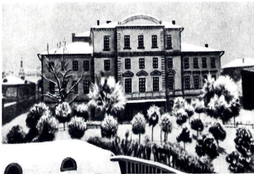
Первая московская гимназия, где учился А. Н. Островский.

Еще в гимназии он увлекается литературой, и первые опыты его литературного творчества относятся к гимназическому времени. В период обучения будущий драматург часто посещает театр.