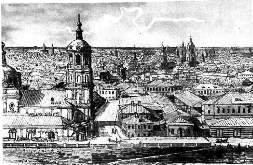
Замоскворечье. С литографии начала XIX века.

Александр Николаевич Островский родился 12 апреля (31 марта по ст. ст.) 1823 года в Москве, в Замоскворечье. Отец его служил в Московском коммерческом суде, выделяясь среди чиновников своим умом и начитанностью. Рано овдовев, он женился снова. Однако вторая жена не занималась детьми мужа от первого брака, поэтому будущий писатель все детство был предоставлен сам себе и рано пристрастился к чтению.