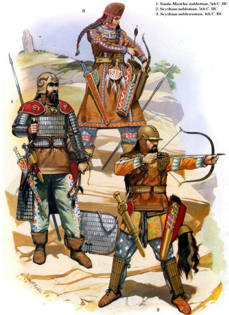
1: Sindo-Meothic nobleman, 5th C. BC 2: Scythian nobleman, 5th C. BC 3: Scythian noblewoman, 4th C. BC

Религиозные представления саков имели ярко выраженную военную окраску. Главными были - культ вождя и царя. Царь считался - избранником богов, посредником между небом и землей, центром мира, носителем земного процветания. От его физической мощи и духовной энергии зависло благосостояние народа. Он был воплощением всех слоев народа. Он проводил первую борозду на весенней пахоте.